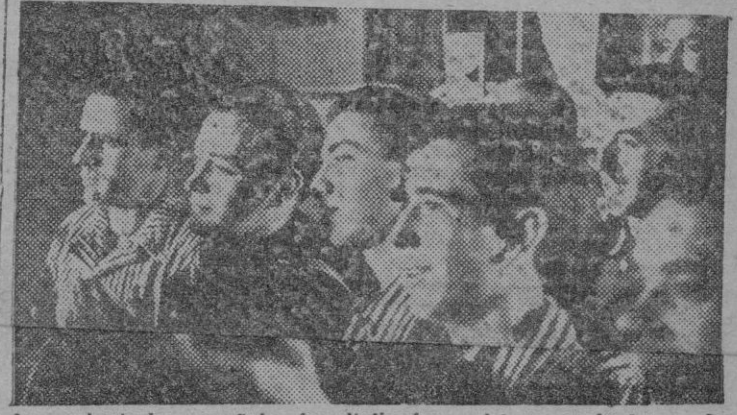
Los voluntarios españoles hospitalizados, asisten, sonrientes, a la fiesta dada en su honor.

El día 23 de junio actual aprobaron el primer ejercicio de las oposiciones a Inspectores Diplomados del Tributo los opositores números: 39, 218, 225, 232, 233 y 235. Para el día 24 estaban llamados desde el número 236 al 258 ambos inclusive.