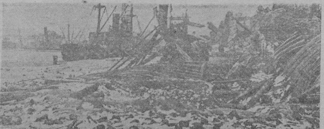
Una vista apocalíptica del puerto de Kertch, escenario de la gran batalla que dio la victoria a las armas alemanas después del violento ataque de cientos de «stukas»