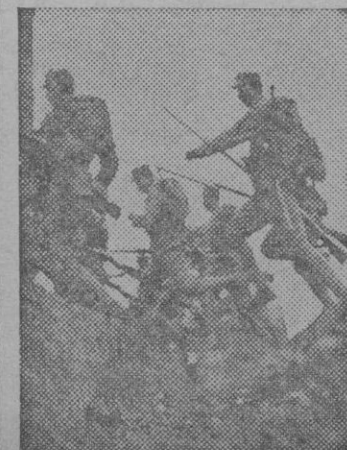
Soldados nipones se lanzan al asalto de las posiciones chinas con la agilidad y audacia que caracterizan a los «Samurai»

Barcelona. — 370 productores que componen la cuarta expedición que marchan a trabajar a Alemania han salido en tren especial con dirección a Hendaia. La estación se hallaba profusamente engalanada con banderas y gallardetes y fueron despedidos por las autoridades y jerarquías. A las nueve y media de la mañana arrancaba el tren, al mismo tiempo que se cantaba el «Cara a Sol».—Cifra.