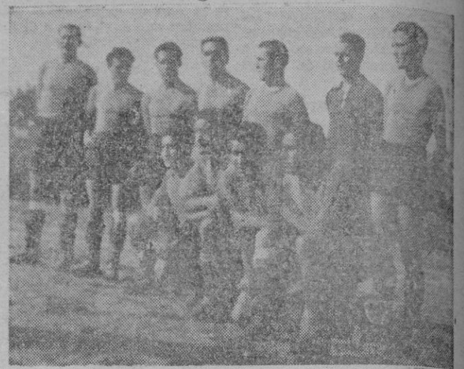
Equipo del C. D. Poblense, campeón absoluto de Baleares en II Categoría y recién ascendido a la primera después de haber vencido en los dos encuentros de promoción a la Gimnástica de Felanitx (0-2), (4-0)