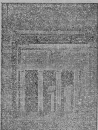
Monumental entrada de la Cancillería

Así son estas grandiosas construcciones alemanas, en todos sus aspectos y categorías, dominadas por su voluntad y su fuerza de espíritu, su fe política y su gran autoridad, sobre las que tan acertadamente dijo Hitler en un discurso el año 1937: