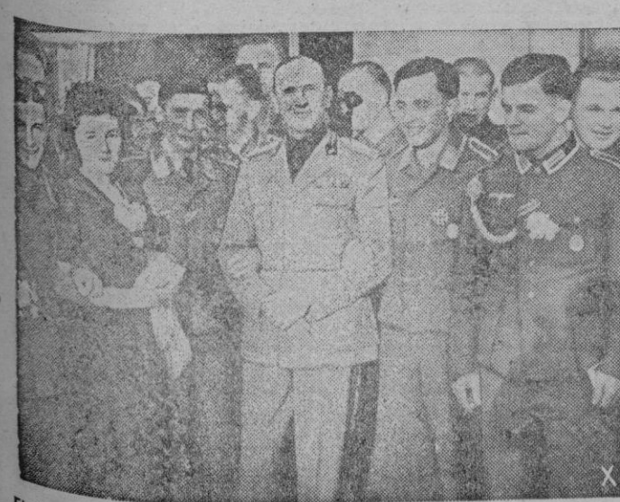
El Embajador italiano en Berlín Dino Alfieri, dió una fiesta en honor de los heridos alemanes e italianos de los hospitales berlineses. A la fiesta asistió la popular «estrella» del cine alemán Jenny Jugo que aparece en la foto con el Embajador y algunos heridos.