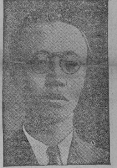
PU-YI Emperador del Manchukuo

A los actos de honor asistieron altas personalidades japonesas Shingking.— El Presidente del Gobierno nacional chino Wang Chingwei y su séquito han sido recibidos en audiencia por el Emperador Wangchingzei le informó de un mensaje que expresa sus votos de prosperidad al Manchukuo el mantenimiento de relaciones amistosas entre los dos países. El Emperador contestó con cálidas palabras y seguidamente recibió en audiencia personal a Wangchingwei y miembros más destacados del séquito. Luego el Emperador acompañó al Presidente del Gobierno chino