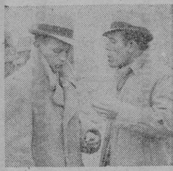
TRAVIESO Y PRATS

entrenadores del Constanca y Mallorca, son los únicos que real- mente saben las alineaciones que presentarán los dos onces rivales, en este encuentro de esta tarde en Buenos Aires, verdadera final de Copa y verdadero plato fuerte para la afición.