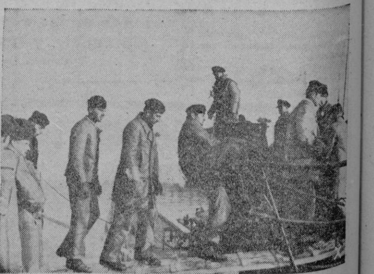
Un submarino del Reich ha vuelto de un victorioso cruceo por aguas norteamericanas. Aquí vemos la operación de amarre del mismo a su muelle donde será minuciosamente reparado y la tripulación podrá bajar a tierra con permiso.