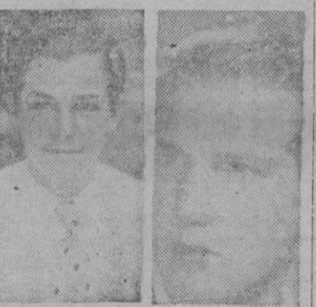
IGARTUA TARRASA II

Hoy a las doce en el Fron- tón Balear tendrán ocasión los aficionados de comprobar si en verdad existe una diferencia de