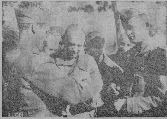
Los sanitarios italianos en su labor de curación de soldados soviéticos heridos hechos prisioneros por sus vanguardias acorazadas en los sectores de Ucrania.