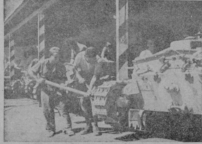
La otra foto nos muestra un taller improvisado verdadero «sanatorio» de tanques, en donde arreglan sus averías y son revisados detenidamente por obreros especializados, antes de volver al campo de batalla