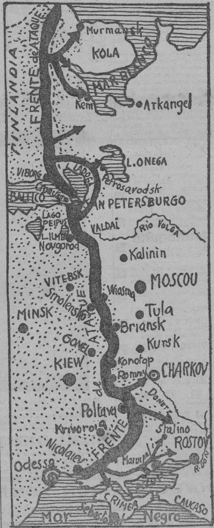
(Trazado por A. C. exclusivo para BALEARES)

He aquí en este mapa la situación de los frentes del Este con fecha de ayer por la mañana. La línea gruesa indica las posiciones que ocupan los grupos de los Cuerpos de Ejército atacantes y las flechas las direcciones de los avances que se están desarrollando con gran éxito y que apuntan hacia inmediatos objetivos. Los detalles que el lector necesita para orientar su lectura de noticias y crónicas de guerra del momento los encuentra también en este mapa especialmente trazados para su mejor comprensión de la campaña de Rusia.