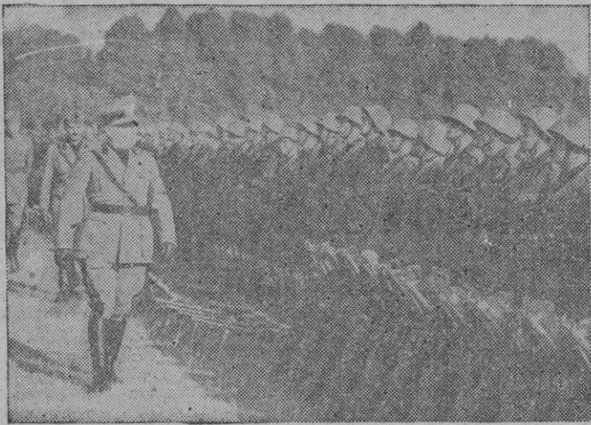
El Duce pasa revista a los batallones de Camisas Negras destinados al frente del Este, y que con sus camaradas del Ejército participarán en la batalla contra el Soviet