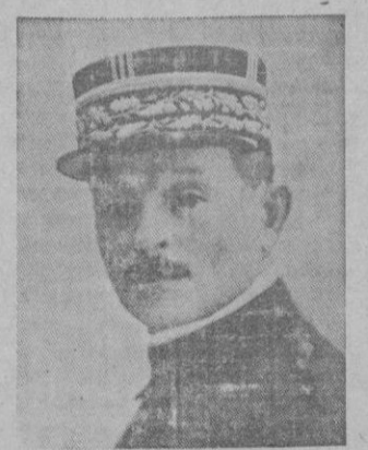
Weygand sustituye a Gamelin

París.—El general francés Weygand ha sido nombrado Generalísimo del Ejército francés y Jefe del Estado Mayor Central. Las tropas nacionales llegaron junto a Irún y allí se abrió un campamento de espera, pues era preciso antes de continuar el avance, apoderarse de los fuertes de Guadalupe, llave de aquellos valles. Fueron fuertemente artillados y en comunicación constante con Francia, de donde les proveían de cuanto le era necesario, la resistencia de los milicianos no tenía nada de heroica, pues sabían que en último caso, la frontera les quedaba abierta, para salvar las vidas, ya que no el honor. Allí entró en lucha por primera vez el «Abuelo». Sus piezas de grueso calibre atronaron el espacio y las granadas pasaban roncando para explotar en los objetivos señalados. Había que afinar la puntería, pues el menor error en los cálculos, hubiera hecho que fueran a reventar en tierra francesa, creando un conflicto con quien no estaba muy bien dispuesto hacia nosotros. Cayó Guadalupe y desde la mar pudieron verse las negras columnas de humo que marcaban la destrucción de Irún, incendiado, después de