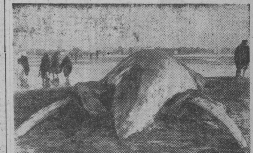
Un monstruo marino ha aparecido en las costas de Egipto, junto a Akaba. Este animal tiene todo el aspecto de una ballena aunque más aplastada y con unos colmillos semejantes a los elefantes. La foto nos la muestra en la playa donde varó. Por las personas que la contemplan tendremos una medida de comparación.