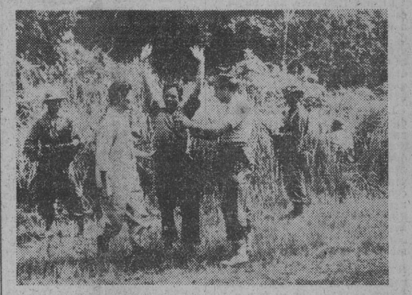
Grupos de bandidos comunistas, que viven en las copas de los árboles en lo más intrincado de la jungla malaya, realizan asaltos y correrías en los pueblos del Estado de Johore. Lenta, pero seguramente, escuadrones de la Policía van reduciendo estos focos de agitación. Aquí vemos el momento de la detención de uno de estos malhechores comunistas.