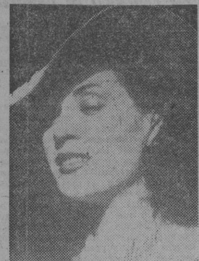
FIGURA DEL TEATRO