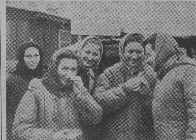
He aquí cinco de las 1.000 mujeres alemanas que desde el año 1945 han estado internadas en un campo de concentración soviético. Su primera ilusión al llegar en la zona americana fue comprarse jabón y perfumes, cosa que han pasado todos estos años sin ver ni oler.