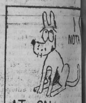
ATSON AT EON