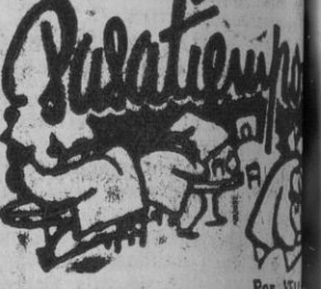
Jeroglífico núm. 2.478. TERMINO LA CARRERA.

BÉRLIN, 19. — La Cámara del Estado alemán ha aprobado una resolución en la que expresa la gratitud a Stalin por la carta de felicitación al presidente Pieck. Asistieron a la sesión representantes de la Unión Soviética, Polonia, Hungría, Checoslovaquia y Suiza. — Efe.