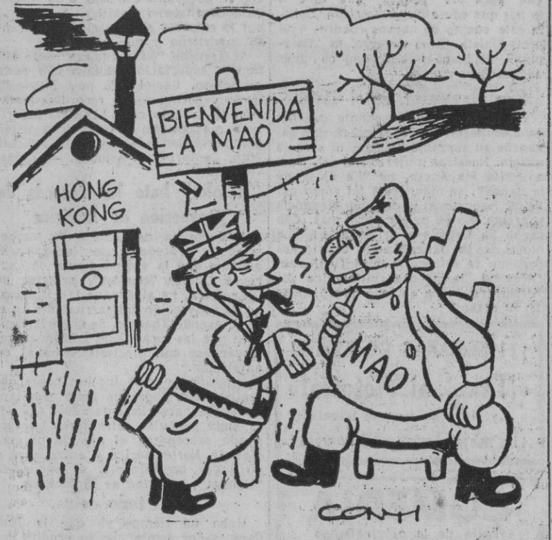
—¿Quién le ha dicho que mi país no aprecia el comunismo? Eso son bulos de los Estados imperialistas, querido amigo.