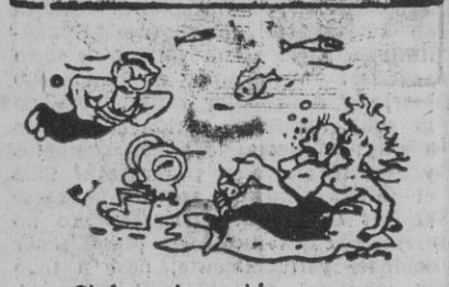
Cielo, mi marido.