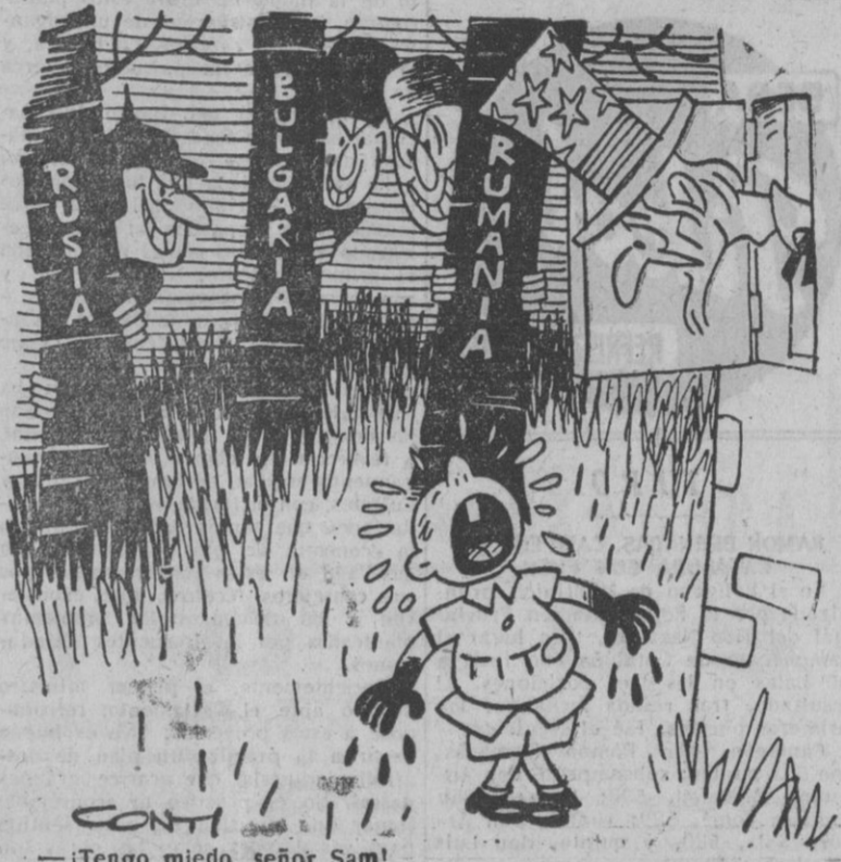
— ¡Tengo miedo, señor Sam!