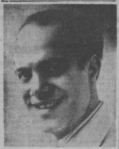
FIGURA DEL TEATRO