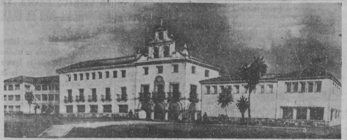
He aquí la maqueta del proyecto de Seminario mayor y menor de Sucre, (La Paz), encargado por la jerarquía eclesiástica boliviana a los arquitectos españoles.