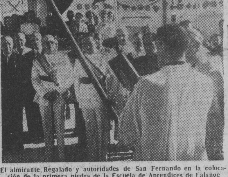
El almirante Regalado y autoridades de San Fernando en la colocación de la primera piedra de la Escuela de Aprendices de Falange.

GUATEMALA, 21. — Reina absoluta calma en todo el territorio, según declaraciones del ministro de Defensa, coronel Arbenz. El Cuartel de la Guardia de Honor se rindió incondicionalmente después de ser capturado en su totalidad por las fuerzas gubernamentales. Parece que los dirigentes sublevados son Mario Méndez Montenegro, ex alcalde de la capital y partidario del asesinado coronel Arana, y los colonos Saturnino Barrera y Jorge Barrios Solares, militares de las fuerzas armadas, sin significación política. Prevalce el Decreto sobre restricciones de las garantías constitucionales por espacio de 30 días. — Efe.