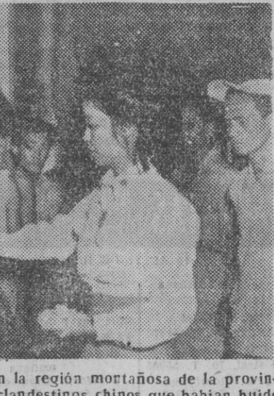
Fuerzas filipinas han capturado en la región montañosa de la provincia de Quezon a 226 inmigrantes clandestinos chinos que habían huido del avance rojo en su país y que merodeaban por aquellos parajes. Todos ellos han sido vacunados previamente y después deportados de nuevo a Amoy, de donde procedían.