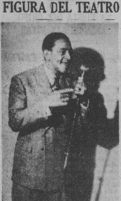
Antonio Machin, el notable intérprete de ritmos y canciones tropicales, que triunfa en Roma con su espectáculo "Melodías de Color"