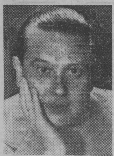
FIGURA DEL TEATRO