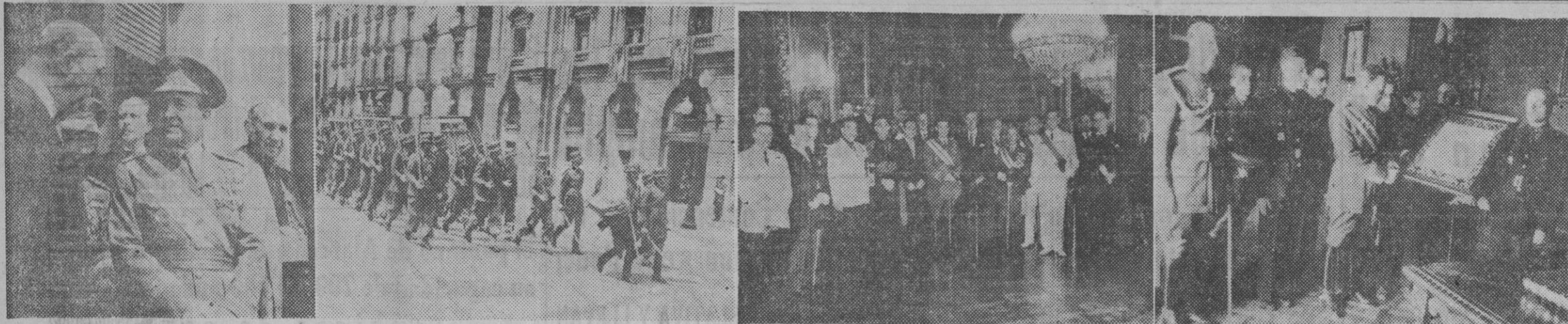
En el palacio de Capitanía se ha celebrado este mediodía una solemne recepción con motivo de la fiesta del 18 de Julio, a la que han concurrido todas las autoridades y representaciones de todas las clases sociales, así como de todas las Armas y Cuerpos militares. He aquí al gobernador militar, que presidió el acto, junto con el señor obispo, el alcalde y el jefe del Estado Mayor en el balcón principal presenciando el desfile que ha tenido lugar después de la recepción; un momento del desfile de las fuerzas; las autoridades y Cuerpo Diplomático que han asistido al acto, y, finalmente, el Frente de Juventudes hace entrega de un pergamino a la autoridad militar en el "Día del Valor".