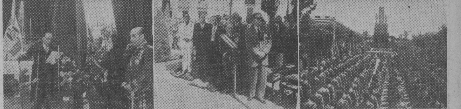
Con asistencia del capitán general, jefe del Estado Mayor Central y demás autoridades y jerarquías, se han celebrado en Tarrasa los actos para festejar la instalación de una guarnición permanente en la ciudad. En las fotografías se detallan varias instantáneas de los actos; ofrecemos el discurso del alcalde de la ciudad, la presidencia de autoridades y la fuerza formada frente a la estatua de los Caídos.

Fervoroso homenaje al Ejército, en Tarrasa