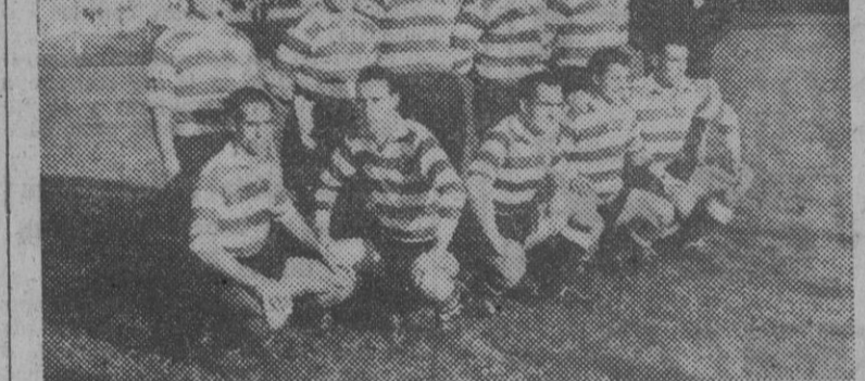
El Sporting de Lisboa, que actuará frente al Club Torino, en partido de eliminatoria de la Copa Latina, a disputar en Madrid.

conseguido colocarse a la cabeza del fútbol de sus países: Italia, Francia, Portugal y España, representadas por sus Campeones de Liga, van a disputar, en Barcelona y Madrid, una supremacía de carácter deportivo de excepcional trascendencia.