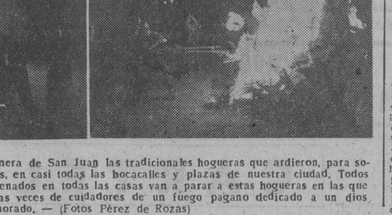
No podían faltar en la noche verbenera de San Juan las tradicionales hogueras que arrieron, para soledad y alegría de grandes y pequeños...

No podían faltar en la noche verbenera de San Juan las tradicionales hogueras que arrieron, para soledad y alegría de grandes y pequeños, en casi todas las bocacalles y plazas de nuestra ciudad.