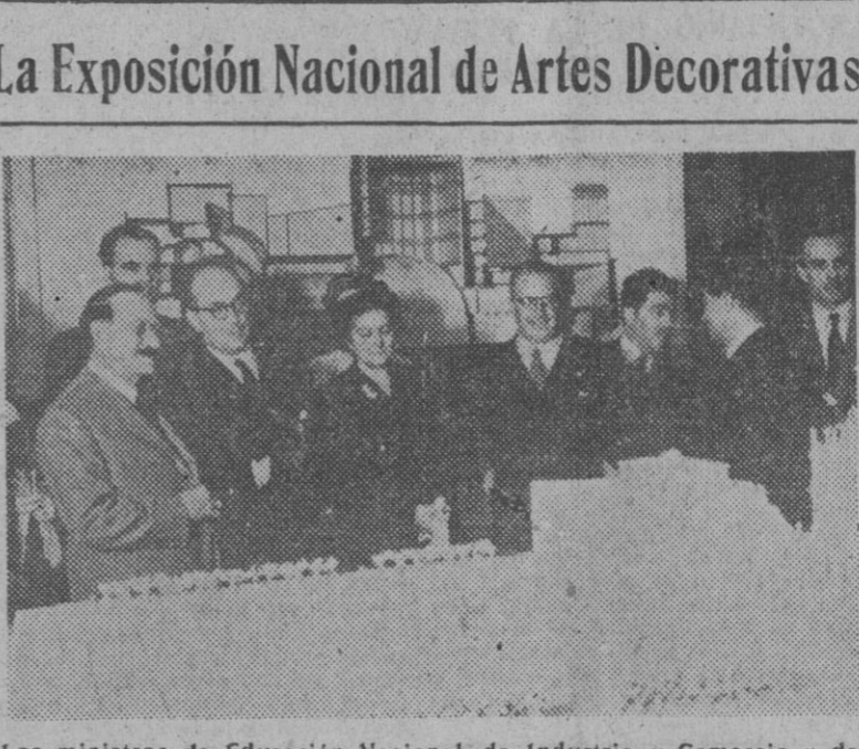
Los ministros de Educación Nacional, de Industria y Comercio y del Aire, acompañados del director general de Bellas Artes y otras personalidades durante el acto de apertura de la Exposición Nacional de Artes Decorativas instalada en el Retiro, de Madrid. Los visitantes examinan uno de los trabajos presentados.