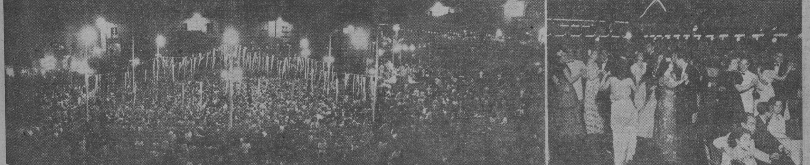
Como todos los años la tradicional verbena de San Juan se ha celebrado en Barcelona con gran brillantez y esplendor. Todo el pueblo barcelonés, en bullanguera alegría, se lanzó a la calle dispuesto a pasar la noche de la mejor manera posible. Todos los lugares de diversión de nuestra ciudad se vieron abarrotados de público hasta altas horas de la madrugada. Indiscutiblemente los lugares que se vieron más concurridos fueron el parque de Montjuich, donde estaban instaladas numerosas atracciones de feria, y el Pueblo Español. En la foto vemos un aspecto de la Plaza Mayor del Pueblo Español, en la que dos orquestas se renovaban en la misión de amenizar la noche a la numerosa concurrencia que la llenaba.