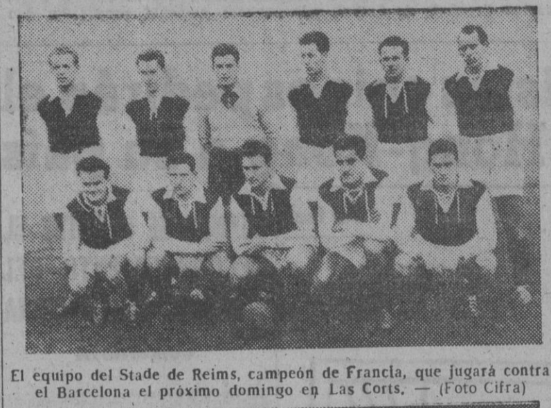
El equipo del Stade de Reims, campeón de Francia, que jugará contra el Barcelona el próximo domingo en Las Cortes.