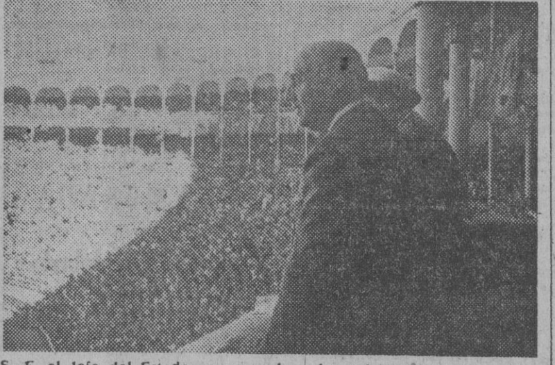
S. E. el Jefe del Estado corresponde a las aclamaciones del público que llenaba ayer la Plaza de Madrid...

Luis Miguel "Dominguín" obtuvo un resonante triunfo