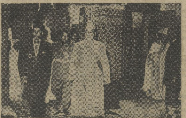
El hijo del sultán de Marruecos, que acudió a Tetuán para felicitar al jalifa por su reciente boda, es recibido en el palacio del Mexnar por S. A. I.