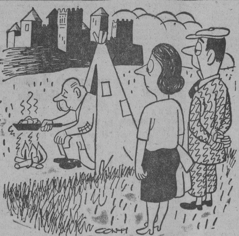
—Aquella es la señorial mansión de Lord Lewistone, y ése es Lord Lewistone.