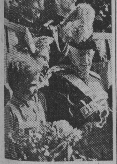
gobernando a su país 41 años, seis meses y ocho días. Ha pasado la mañana en su castillo de Tullgara, y esta tarde ha visitado el buque "Ormen Friske", reproducción exacta del buque de los Vikingos, tripulado por miembros de la Organización Juvenil "Sahud". El rey jugó su último partido de tenis a los 88 años; pesca todos los días y se encuentra sano física y mentalmente.—Efe.

STOCOLMO, 16. — Gustavo V de Suecia, el monarca más anciano de los tiempos modernos, celebra hoy su 92 cumpleaños. Leva