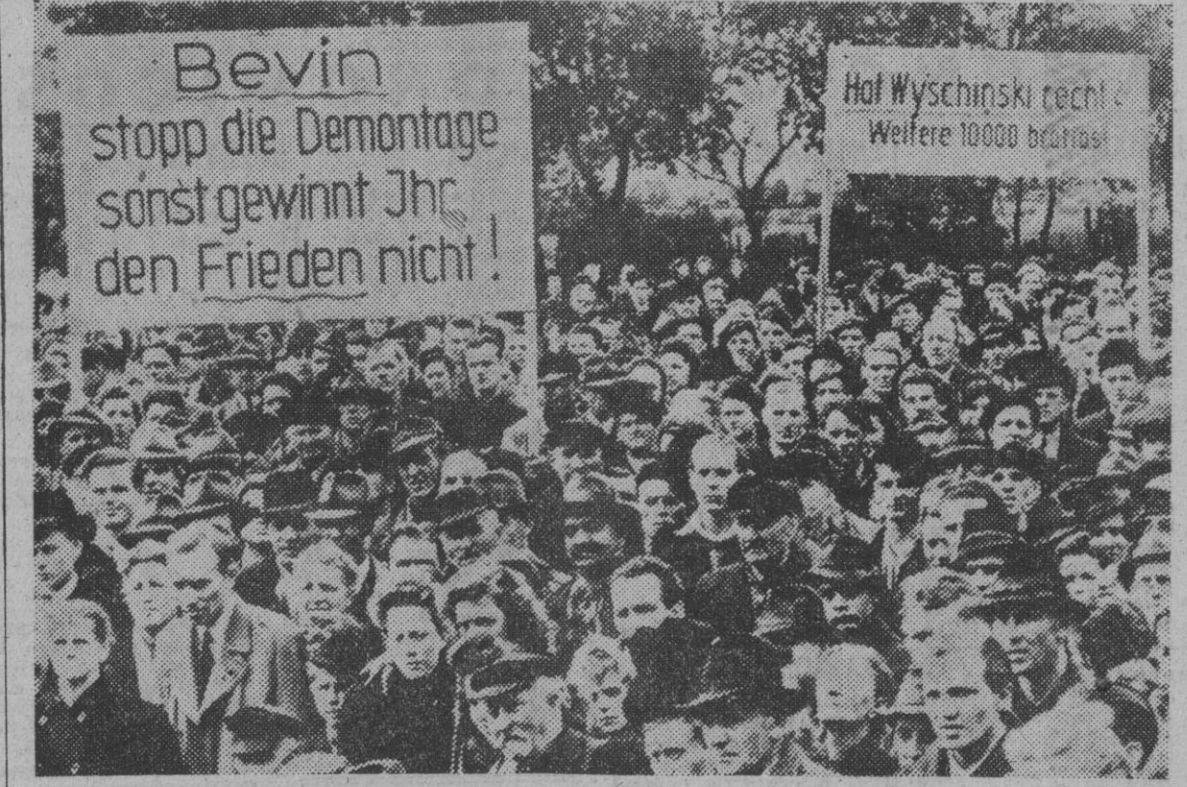
Más de 6.000 obreros de varias localidades de la cuenca del Ruhr, organizaron una manifestación en señal de protesta por el desmantelamiento de las grandes instalaciones para fabricar gasolina sintética establecidas en aquella cuenca, llevado a efecto por las autoridades aliadas.