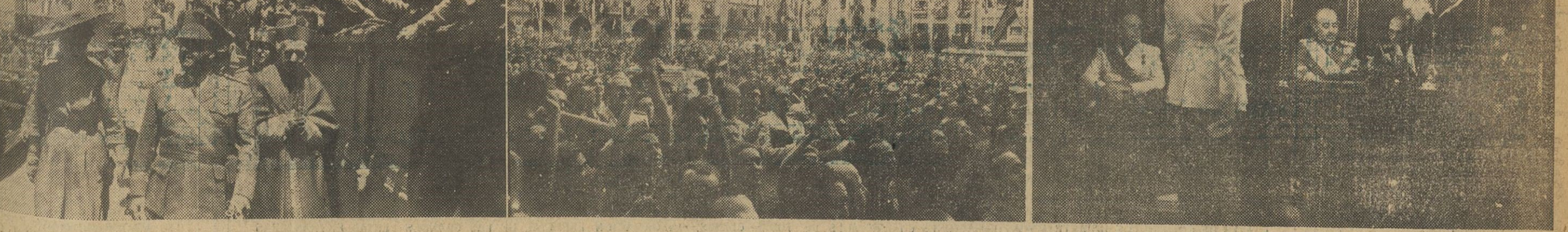
I. S. E. el jefe del Estado y su esposa salen de la Catedral de Vich, después de la magnífica disertación con que S. E. clausuró el Congreso Internacional de Apologeta. El público que llenaba completamente la plaza, aclamó con entusiasmo al Caudillo y a su esposa. — II. Otro de los momentos emocionantes de la estancia de S. E. en Vich, fue la presencia del Generalísimo en el balcón principal del Ayuntamiento para presenciar la fiesta folklórica celebrada en su honor. La foto nos muestra sólo un reflejo de las apoteósicas ovaciones y aclamaciones al jefe del Estado. — III. En el salón de sesiones del Ayuntamiento vicense fue entregada a S. E. la Medalla de Oro del Centenario de Balmes, momentos antes de partir para Barcelona.

obra de renacimiento espiritual de España. Sé que en el esfuerzo que os anima late el deseo de alcanzar el más alto nivel de cultura para nuestra Patria, y me complace en proclamar la satisfacción que me produce el hecho de que una vez más, en la vanguardia de la vida española, aparezca Cataluña rindiendo su mejor tributo de lealtad a la historia del pensamiento nacional. La capacidad de estudio e investigación de las figuras más destacadas