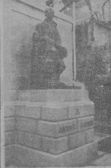
El monumento a Balmes, que ha sido costado por las Diputaciones catalanas, y que fue inaugurado ayer por S. E. el Jefe del Estado

Y con este propósito reconstructivo del patrimonio artístico de la Nación ha corrido parejas ese otro nobilitado, designio de exaltar cada día las figuras y los hechos de nuestro patrimonio histórico, no dejando pasar oportunidad alguna de evocación conmemorativa, como esta del eximio filósofo Balmes que ahora festejamos.