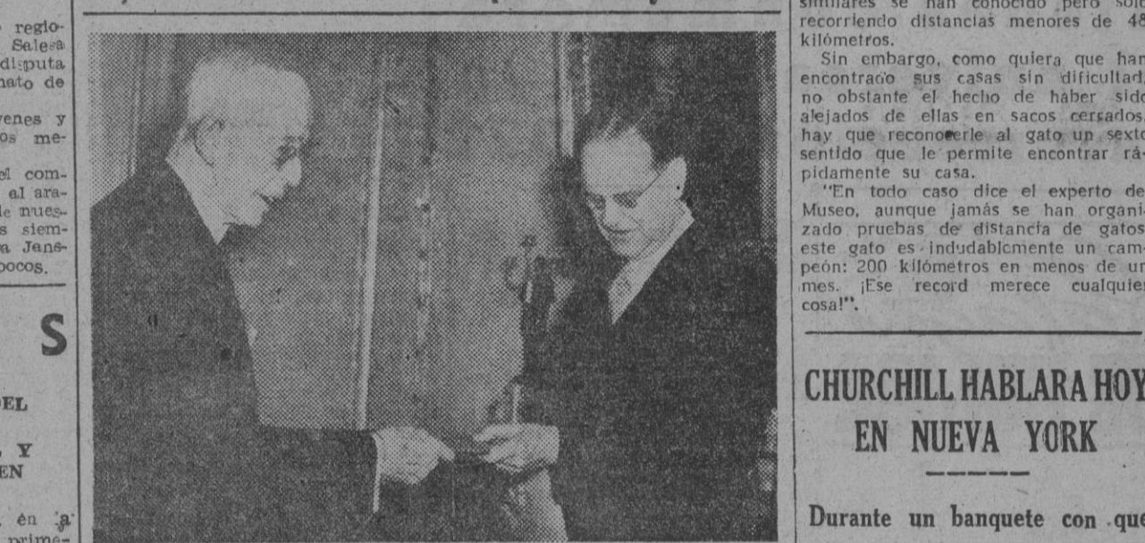
El rey Gustavo V de Suecia recibió en audiencia en el castillo de Drottningholm al Comité Real de 1948, presidido por el primer ministro Tage Friander, quien le entregó la suma de dos millones de coronas, reunidas por el Fondo del Rey Gustavo para la Juventud Sueca. En la fotografía, el primer ministro en el momento de entrega al anciano monarca esta cantidad.