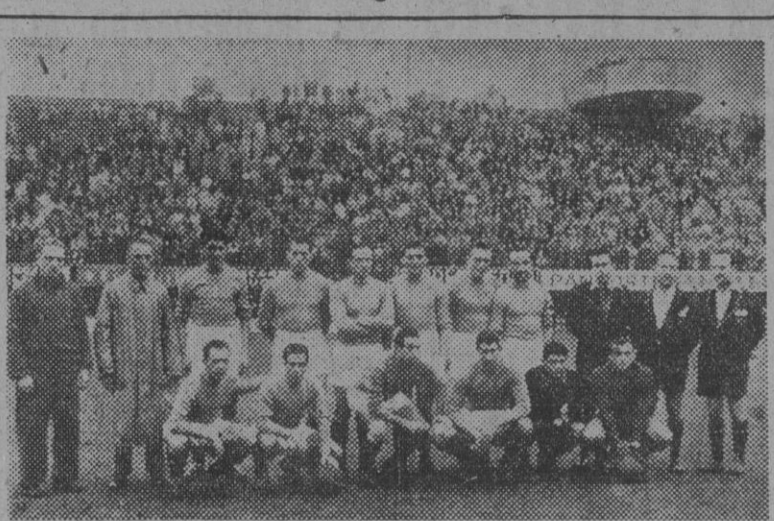
El equipo de la Selección italiana, con uno de sus seleccionadores, el señor Copernico, momentos antes de iniciar uno de los últimos entrenamientos antes de salir para España.