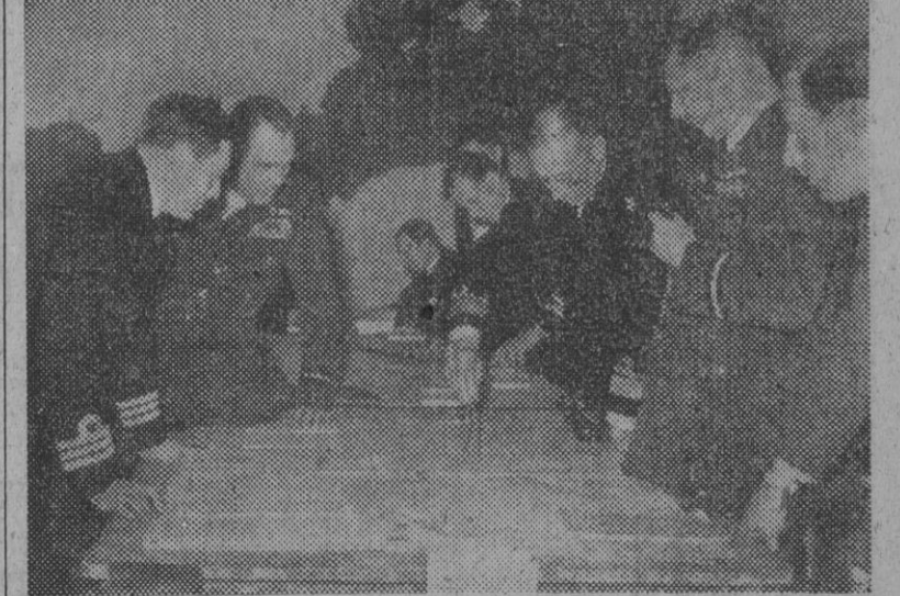
Jefes de las fuerzas aéreas y navales británicas dirigen desde Gibraltar las pruebas de operaciones militares combinadas en el Mediterráneo Oriental.