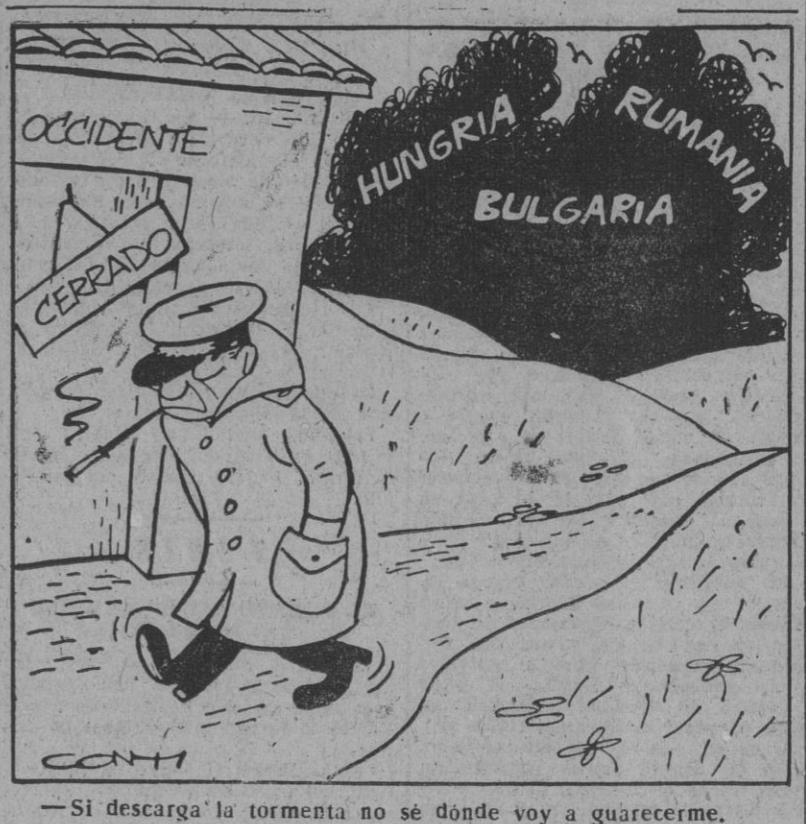
— Si descarga la tormenta no sé dónde voy a guarecerme.