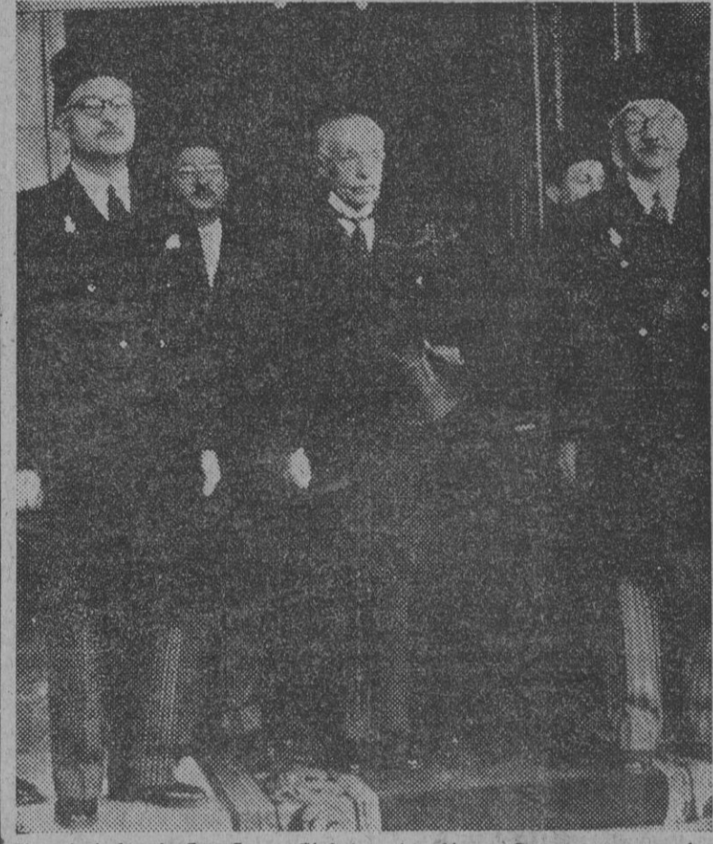
El embajador de España en El Cairo, don Alonso Caro, momentos después del acto de presentación de sus cartas credenciales ante el rey de Egipto.

El embajador de España en El Cairo presenta sus cartas credenciales