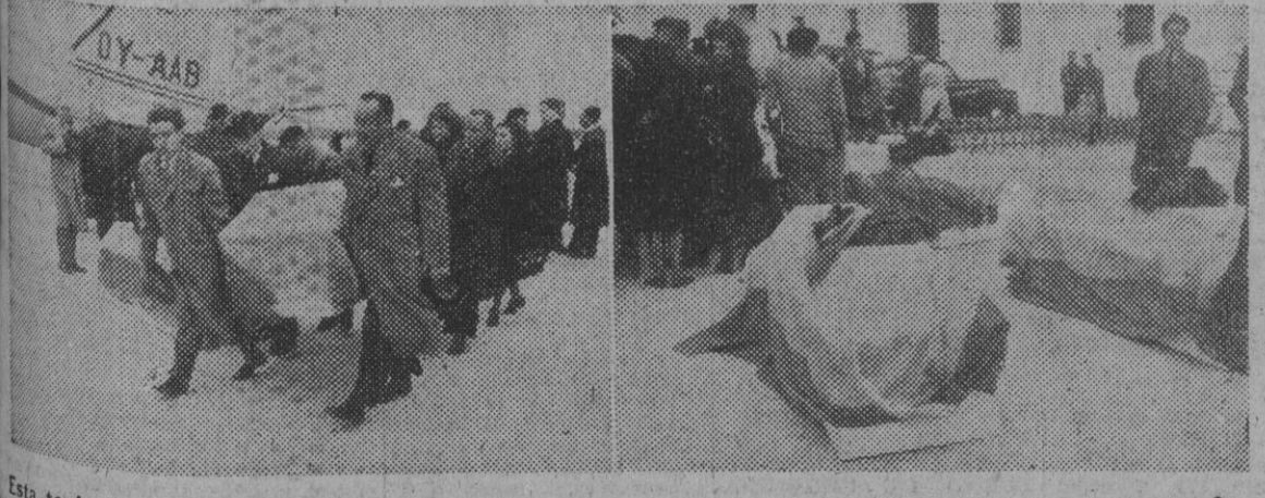
Esta tarde han llegado al aeropuerto del Prat los cuerpos de las víctimas del siniestro de aviación de Copenhague, encerrados en lujosos féretros. He aquí el momento de descenso de los ataúdes del avión que los ha traído.