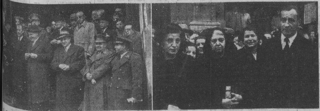
El presidente de las Cortes, don Esteban de Bilbao, acompañado de varios ministros del Gobierno y otras personalidades, que asistieron a las honras fúnebres por el alma del general Primo de Rivera, celebradas en la iglesia de San José, de Madrid. — 2. Don Miguel Primo de Rivera, con su hermana Pilar y otros familiares, a la salida de la función religiosa.