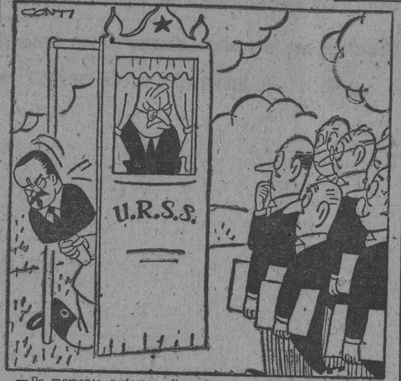
—De momento podemos afirmar que es más feo.