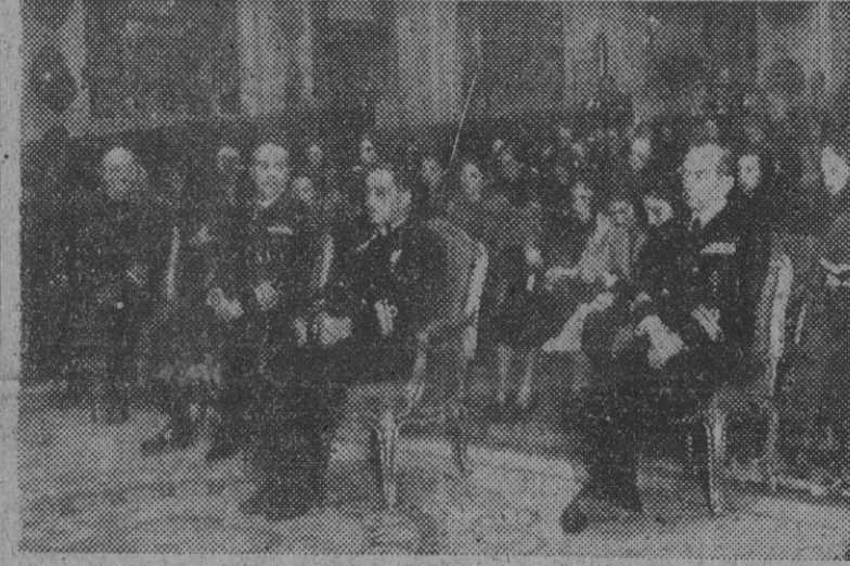
El ministro de Marina, almirante Regalado, acompañado de altos jefes del Departamento, durante la misa celebrada en el Museo Naval por los Caidos del "Baleares", en el aniversario de su hundimiento.

Parece inminente la sustitución del secretario y jefe de Ejército, Royall