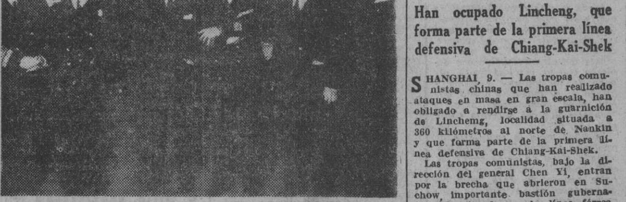
Los ministros de industria y Comercio, Marina y Educación, acompañados de otras personalidades, que presidieron la sesión extraordinaria de apertura de dicho Congreso, celebrada en el Consejo Superior de Investigaciones.

La apertura del III Congreso de Ingeniería Naval