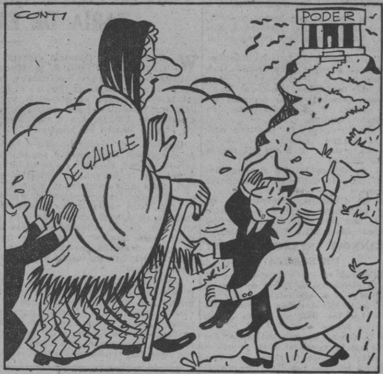
No impacientarse, hijitos. Llegaré muy tarde, pero llegaré.