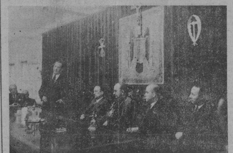
Bajo la presidencia del ministro de Justicia se celebró el acto de la toma de posesión del nuevo asesor nacional de Sindicatos, excelentísimo señor obispo de León. El delegado nacional de Sindicatos en el momento de pronunciar su interesante discurso.