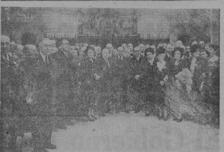
Ayer, noche, el alcalde accidental ofreció una recepción a las autoridades y personalidades que se encuentran en Barcelona con motivo del Centenario del Ferrocarril de Barcelona a Mataró...