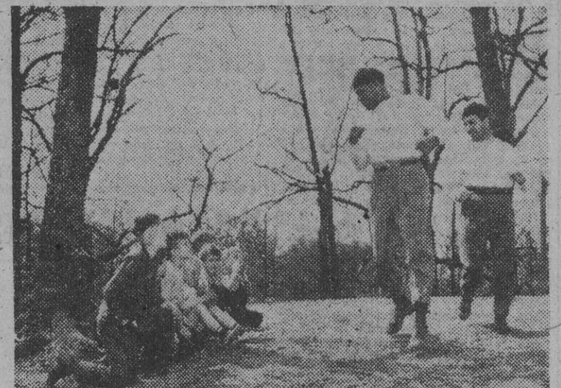
Joe Walcott, el famoso pugil de color que en junio disputará a Joe Louis el título mundial de los pesos pesados, se entrena asiduamente en los jardines de Grenloch Park (Nueva Jersey).