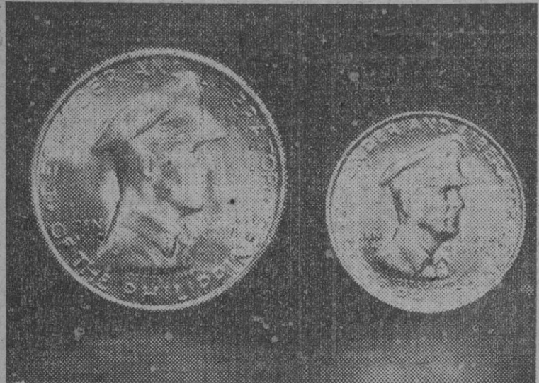
He aquí las nuevas monedas de un peso y de medio peso, acuñadas en Filipinas en honor del general Douglas Mac Arthur como su defensor y libertador.