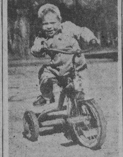
El heredero del trono de Suecia, príncipe Carlos Gustavo, que el día 30 de este mes celebra el segundo aniversario de su nacimiento, juega en los jardines de su residencia donde vive con su madre y sus cuatro hermanas. El pequeño príncipe es hijo de la princesa Sibylla y el príncipe Gustavo Adolfo, que murió en un accidente de aviación.