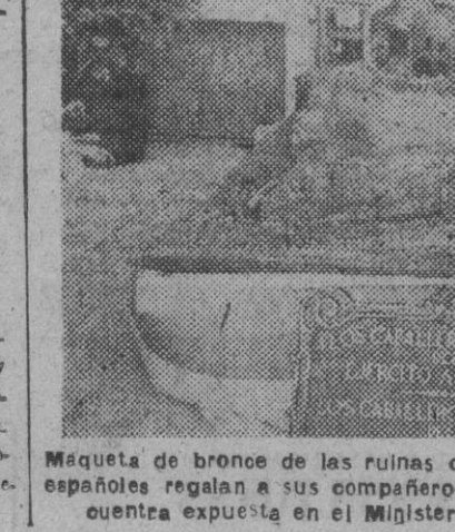
Maqueta de bronce de las ruinas del Alcázar de Toledo que los cadetes españoles regalan a sus compañeros los cadetes argentinos y que se encuentra expuesta en el Ministerio del Ejército.