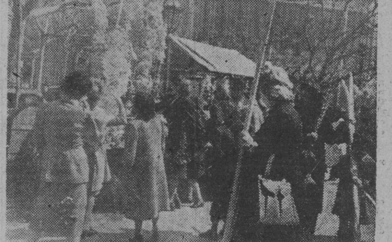
Ha empezado en la Rambla de Cataluña la tradicional feria de ramos y palmas. Algunas de éstas, verdaderas filigranas de concepción y de preciosísimo trabajo, son admiradas por el público.