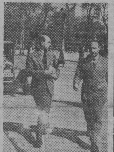
Se encuentra en Madrid el ex rey Humberto de Italia, que aparece en la fotografía pasando por la Avenida del Generalísimo, después de visitar el Museo del Prado.

Gerhardsen, jefe del Gobierno noruego y Hedtoft, primer ministro danés, se han trasladado a esta capital por invitación del partido social democrata sueco y hablarán en una reunión pública esta noche. — Efe.