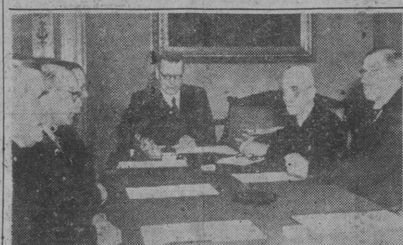
La Delegación finlandesa que negociará en Moscú el tratado impuesto por la presión soviética, reunida en Helsinki con el presidente Paasikivi, antes de emprender el viaje a la capital soviética.

NUEVE PAISES VOTARON A FAVOR DE LA PROPUESTA CHILENA Y DOS EN CONTRA