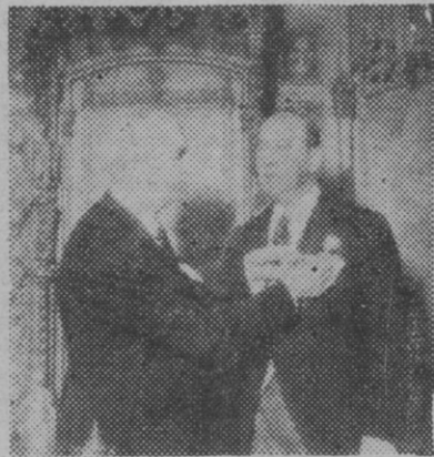
La fotografía recoge un momento del solemne acto celebrado en el histórico Salón de Ciento, con motivo de la entrega al Excmo. Ayuntamiento de la Medalla de Oro de la Previsión...

El Palacio Nacional, encuadrado en el espléndido marco de la Exposición, fue teatro del emocionante homenaje que tributaron a Generalísimo todas las Diputaciones y Ayuntamientos de Cataluña.