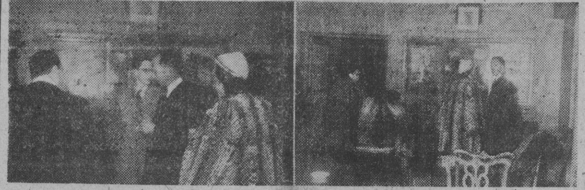
El rey Leopoldo III de Bélgica, acompañado de su esposa e hijos, descansa unos momentos en el aeropuerto de Barajas, de Madrid, durante su viaje desde Suiza, donde permanece en exilio, hasta Lisboa.