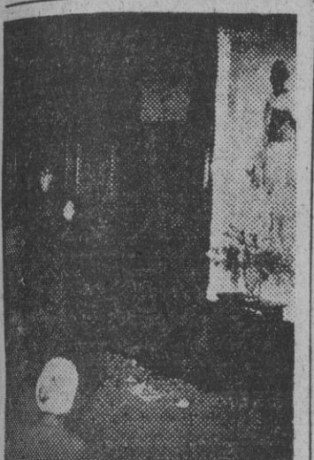
Los seguidores de Gandhi residentes en Londres, se reunieron en la casa de la India mientras duraba el ayuno del mahatma, para rezar por su salvación.