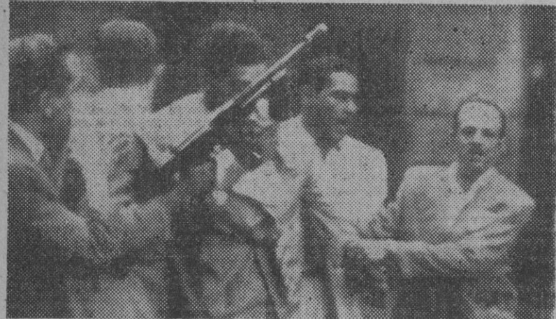
Al conocerse la decisión del Gobierno brasileño de cancelar el mandato de los comunistas en los puestos que ocupaban en los organismos oficiales, en la capital, Rio, se produjeron algunos alborotos que en seguida fueron acallados. El choque de mayor importancia tuvo lugar entre la policía y el personal del periódico comunista "Tribuna Popular". En la foto, el director del periódico conducido a la fuerza por los agentes