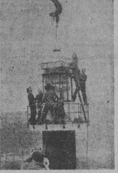
En un "descanso" de su trabajo en la pista del circo, el acróbata "Unus" hace una exhibición a 53 metros de altura, sobre el fero de unos grandes almacenes belgas.