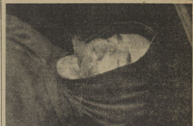
Vestido con el hábito de terciario franciscano, el cadáver de don Mariano Benlliure en su lecho de muerte. (Foto Arinpress).

El maestro Benlliure en su lecho de muerte