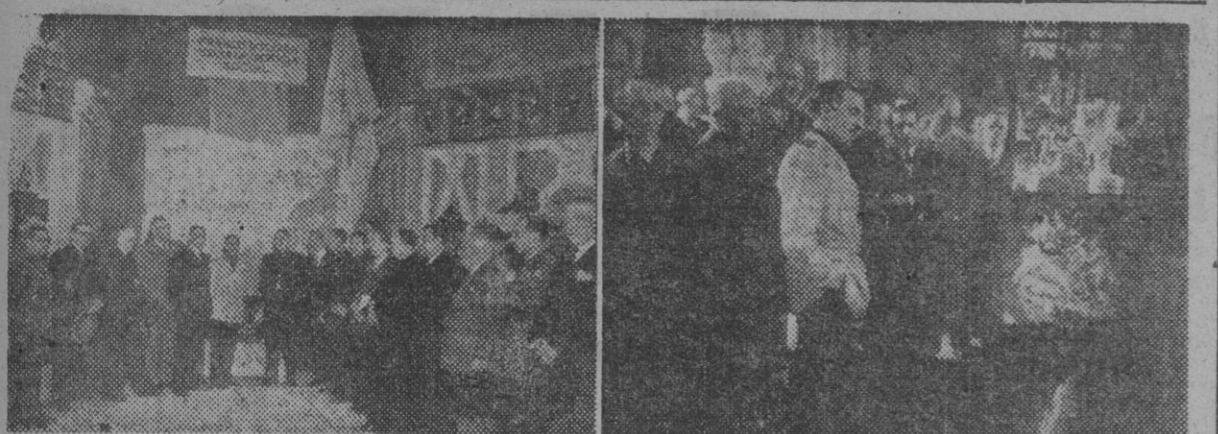
Bajo la presidencia del gobernador civil y del jefe nacional de la Obra fué inaugurada ayer la Exposición Nacional de Artesanía, primera de los actos del Congreso Nacional de la Obra. He aquí dos aspectos del acto. (Fotos Pérez de Rozas).