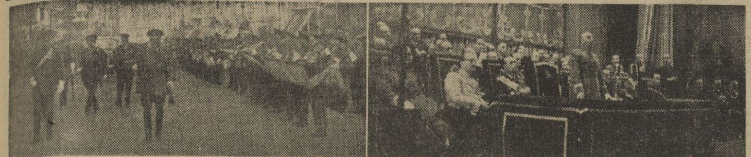
En su Excelencia el Jefe del Estado pasa revista en la Gran Vía a las tropas que le rindieron honores a su llegada para presidir la clausura del Congreso Nacional de Sanidad Municipal. — II. El Generalísimo pronuncia el discurso de clausura. Al acto, celebrado en el cine Capitol, asistió el Gobierno en pleno.

El Caudillo clausura el Congreso Nacional de Sanidad Municipal Se dice que los rebeldes están dirigidos por el coronel Mancheño, quien ha sido detenido