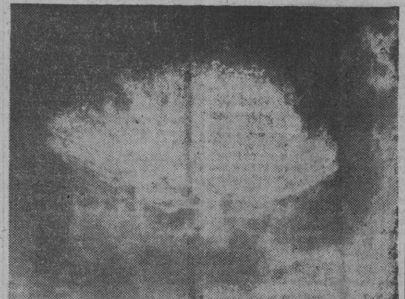
Esta fotografía, obtenida desde un avión que voló a una altura prudencial sobre el huracán que azotó las costas de la Florida, recoge la enorme ola que se formó en el Atlántico. El punto exacto de partida del fenómeno fué localizado gracias a los adelantos del radar.

El boletín indica que la tormenta que ya existía anteriormente al ciclón, en los estrechos de Bahamas y