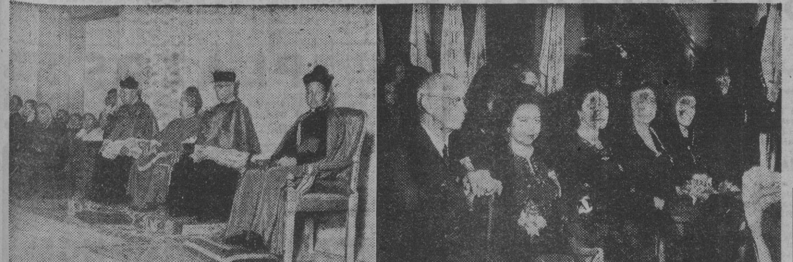
I. El obispo auxiliar de Madrid - Alcalá, acompañado del protonotario apostólico, durante el homenaje que la Acción Católica madrileña dedica a los peregrinos mejicanos. — II. Un grupo de muchachas mejicanas que forman parte de la peregrinación mejicana del Tepeyac, ataviadas con la clásica mantilla española, en el acto celebrado en la catedral de San Isidro.