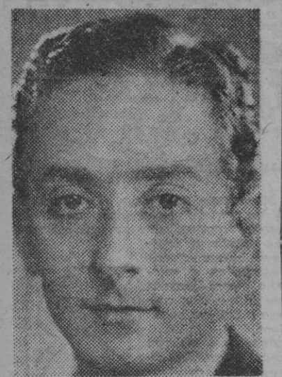
FIGURA DEL TEATRO

Antonio Vico, el admirable primer actor, que celebra hoy su función de homenaje en el teatro de la Comedia con la preciosa obra de los hermanos Quintero. "Los mosquitos"