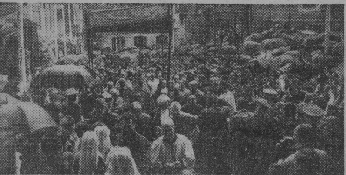
I. Bajo la lluvia, y sin que el pueblo se mueva, en su deseo de ovacionar al Caudillo, S. E. entra en la Catedral bajo palio. — II. La multitud, frenética de entusiasmo, llenando completamente la plaza, balcones y azoteas, hace objeto al Caudillo de delirantes aplausos y vivas.

Solución al núm. 1.821 HORIZONTALES: 1. Botar... 2. Orca... 3. Te... 4. ob... 5. Alabas... 6. Am... 7. Ros... 8. A... 9. Hogar... 10. ON... 11. Apórofo.