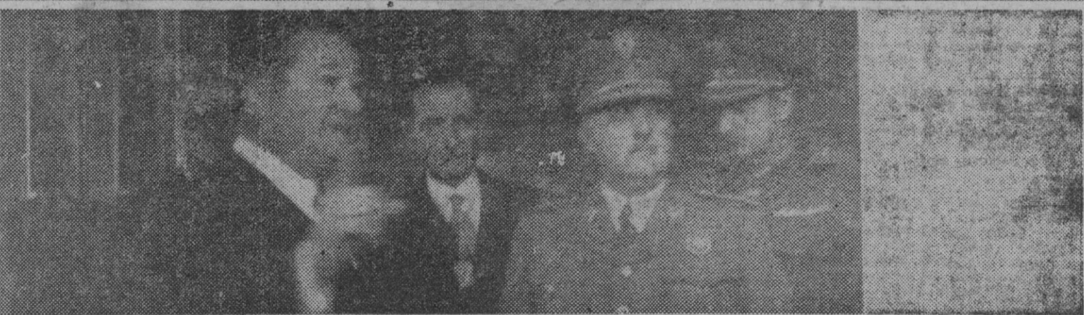
S. E. en el momento de su llegada a Sabadell y visitando una importante instalación industrial.

En Sabadell acudió a recibirle una ingente multitud representativa de toda la comarca que no cesó de vitorearle