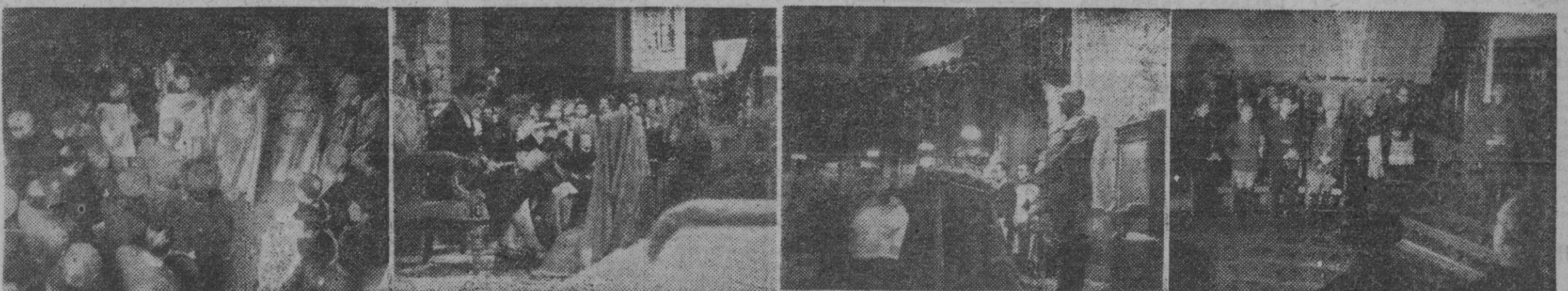
I. El Caudillo es recibido por el abad mitrado y toda la Comunidad a su llegada al Monasterio de Montserrat. — II. La esposa y la hija del Caudillo orando ante la imagen de la «Moreneta». — III. El Caudillo durante la Salve cantada por la Escolanía. — IV. El Jefe del Estado, en la Sala Capitular, contesta al discurso de salutación del P. abad.