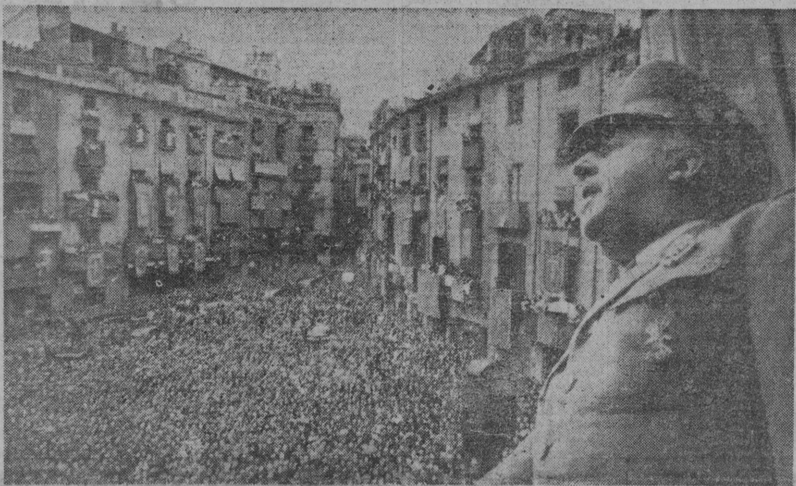
Un aspecto de la plaza del Ayuntamiento de Manresa durante el discurso de ayer de Franco