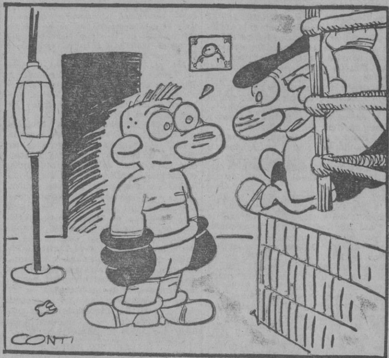
—Para llegar al campeonato necesitas un entrenamiento fuerte, mucha gimnasia y coger cada día el "Metro" de la una.