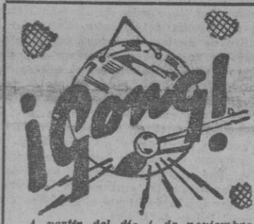
A partir del día 4 de noviembre, según los avisos circulares, se declararán en huelga los alcaides y Ayuntamientos del departamento francés de Eural, que son 112. Esta "huelga administrativa" tiene por objeto apoyar la actitud adoptada por los agricultores frente a las medidas del ministro francés de Aduanamientos.

Plus a los productores que trabajan de noche en la transformación y distribución de energía eléctrica