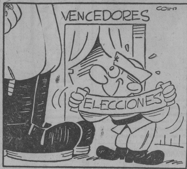
BULGARIA: ¿Puedo entrar?

Negociaciones comerciales entre Argentina y Checoslovaquia