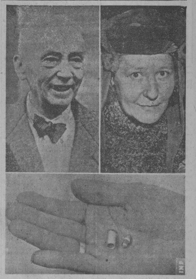
La viuda y el abogado defensor de Goering, últimas personas que visitaron al mariscal del Reich en su celda de Nuremberg, antes de que se suicidara ingiriendo la dosis de veneno contenida en la cápsula de pistola que se muestra en la fotografía inferior.