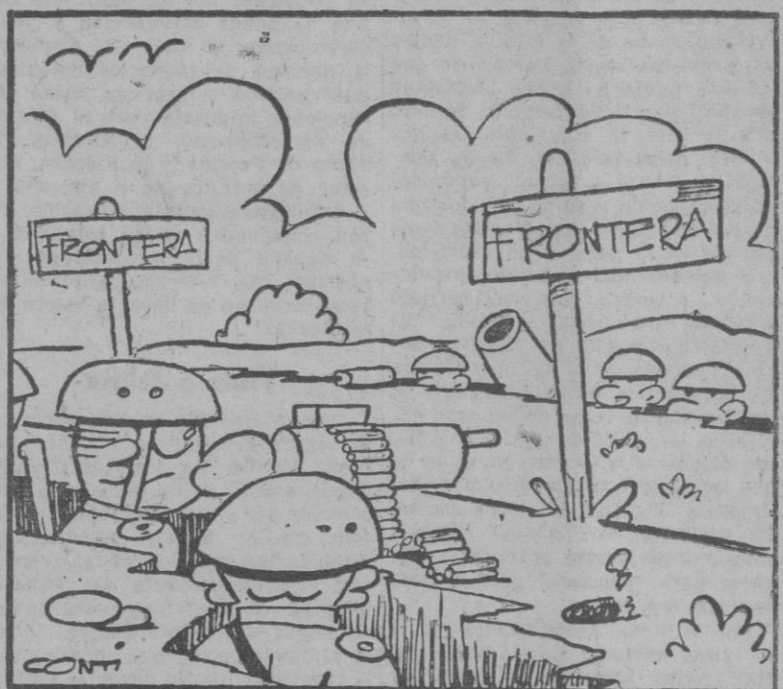
—Como esta paz duró mucho, nos vamos a pasar la vida en las trincheras.