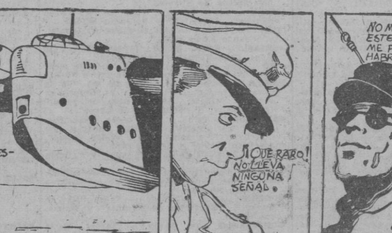
El avión avistó al submarino y se dispuso a prestarle ayuda.