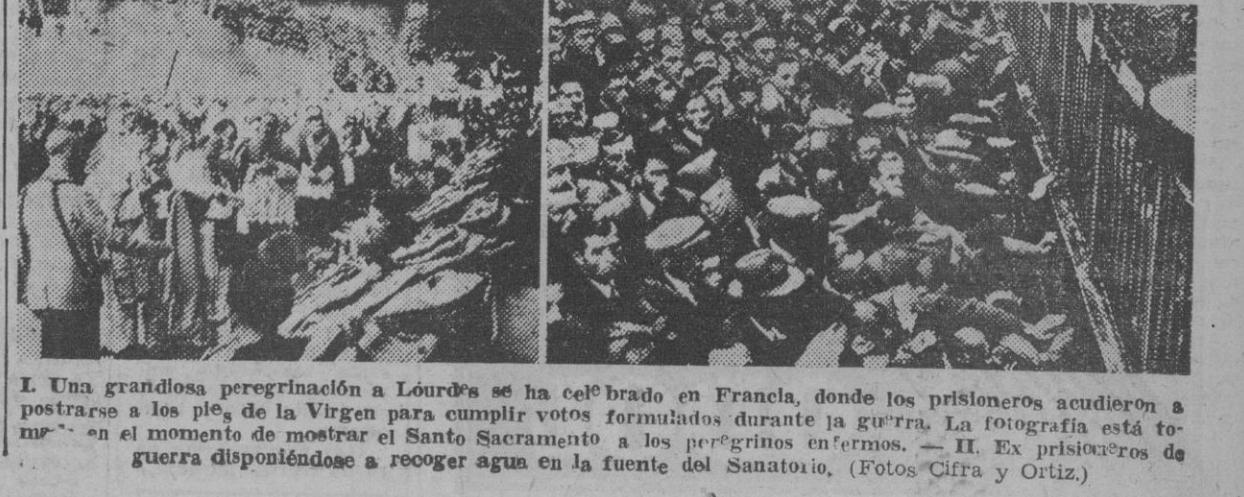
I. Una grandiosa peregrinación a Lourdes se ha celebrado en Francia, donde los prisioneros acudieron a postrarse a los pies de la Virgen para cumplir votos formulados durante la guerra. La fotografía está tomada en el momento de mostrar el Santo Sacramento a los peregrinos enfermos. — II. Ex prisioneros de guerra disponiéndose a recoger agua en la fuente del Sanatorio.