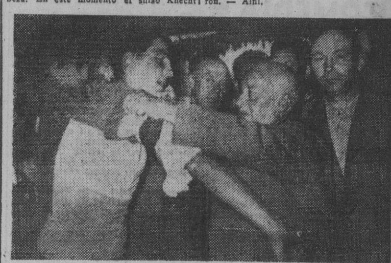
El presidente de la Unión Ciclista Internacional, el belga Collignon, impone el jersey irisado, al holandés G. Poters, nuevo campeón de las pruebas de persecución tras moto en la categoría de profesionales

El austriaco Wudernitz pierde contacto con el segundo grupo, corriendo con Orbalceta, víctimas como