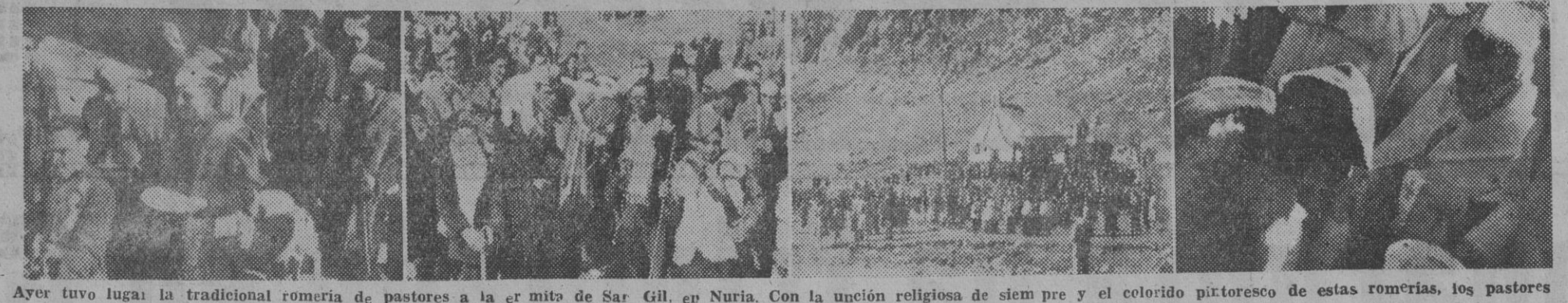
Ayer tuvo lugar la tradicional romería de pastores a la ermita de San Gil, en Nuria. Con la unión religiosa de siempre y el colorido pintoresco de estas romerías, los pastores hicieron su anual ofrenda. Nuestras fotos muestran varios momentos de los actos celebrados.