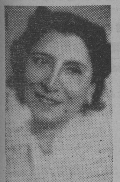
FIGURA DE LA ESCENA

La insigne actriz argentina, Lola Membrives, que tiene anunciado para el próximo miércoles el estreno de la obra de Benavente, "Titania" en el teatro de la Comedia.