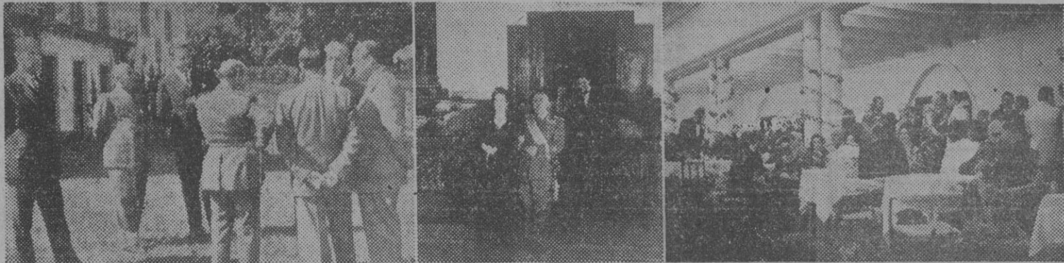
Tres momentos de la jornada veraniega del Caudillo en Galicia. 1. S. E. con algunos ministros del Gobierno en los jardines del Pazo de Meirás, antes de reunirse en Consejo. — 2. El Jefe del Estado dando el brazo a la esposa del alcalde de La Coruña, hace su entrada en el salón donde tuvo lugar la recepción ofrecida por el Ayuntamiento. — 3. El Caudillo acompañado de su esposa y otras personalidades durante la fiesta organizada por el Casino de La Coruña, en un parque de Juan Flores.