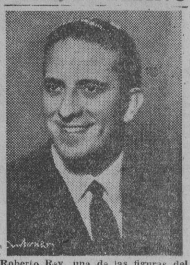
Roberto Rey, una de las figuras del film "Historia de una gran pasión", actualmente en rodaje en Diagonal.