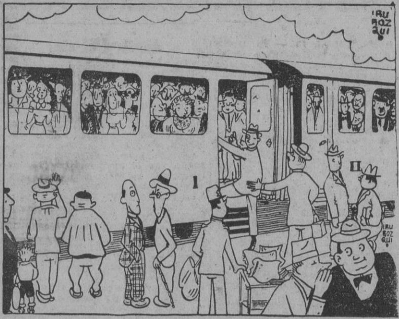
Son veraneantes que van en busca de calor.