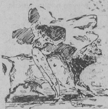
Quite por faroles de Juan Belmonte