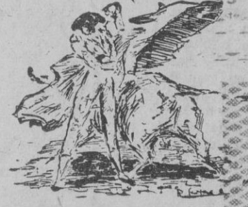
Media verónica cefildísima de «Parrita»

Recuerda mucho a «Manolete» y, sin embargo, toda su prestancia torera se entronca mejor con otras analogías y linajes cordobeses del torear de «Parrita». Torear limpiamente, con honra y conciencia honrosa, cual el maestro «Manolete». Pero ¡¡ay! que no debemos confundir que «Parrita», por lo que se para y aguanta sí, desde luego, semeja al cordobés; pero tiene un torear distinto, personal, en detalles y maneras que no deben escapar al buen aficionado. Reposadamente, tranquilo, resuelto íbase al toro, encelando y citando de largo y en corto, al natural, esgrimiendo la bandera en la zurda. Series varias de naturales que provocaron un verdadero torrente de explosión entusiástica. En los dos toros, por difíciles,