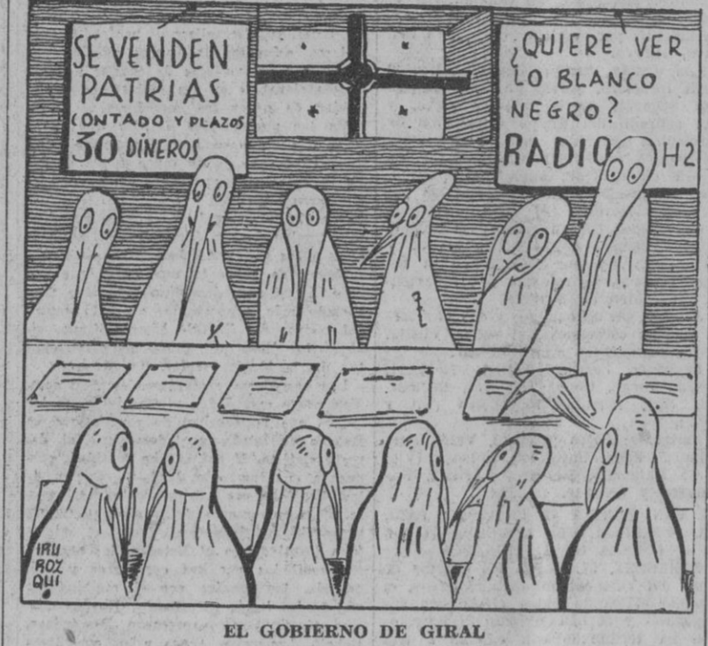
EL GOBIERNO DE GIRAL