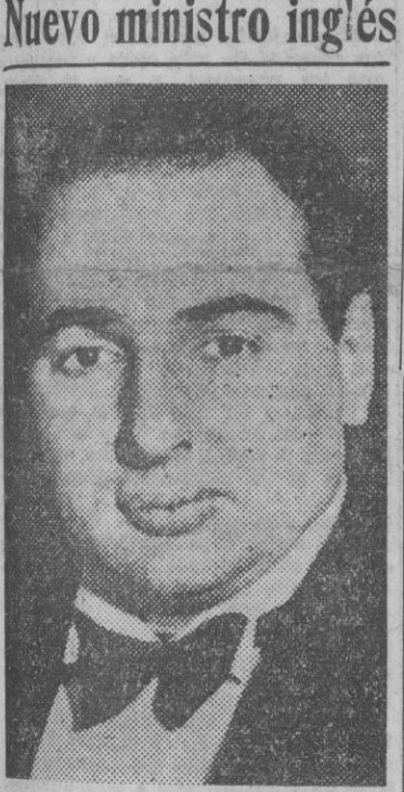
Mr. John Strachey, nuevo ministro británico de Alimentación