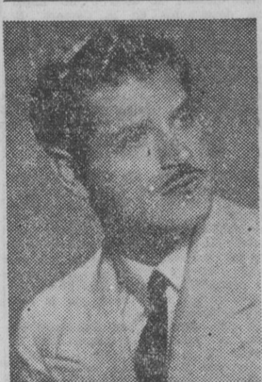
FIGURA DEL TEATRO

El notable compositor y cantante José García de Empedrado, que al frente de su orquesta está obteniendo grandes éxitos