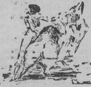
ance a la verónica de Luis Miguel «Dominguín»