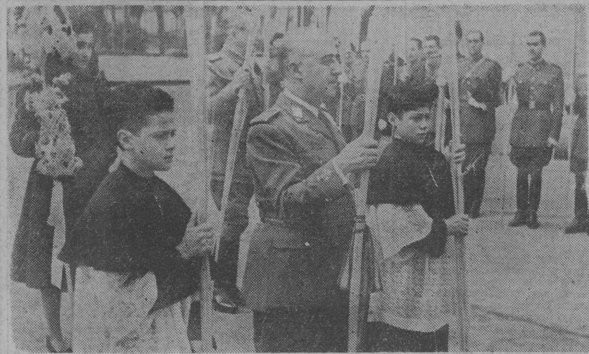
Su Excelencia, el Jefe del Estado, Generalísimo Franco, en la procesión del Domingo de Ramos celebrada en El Pardo en el mismo instante en que las fuerzas enemigas de nuestra catolicidad y soberanía se esfuerzan en inventar nuevas calumnias para trarnos otra vez el control de Rusia y de los hombres de su "quinta columna".

Mientras los enemigos de España injurian a Franco