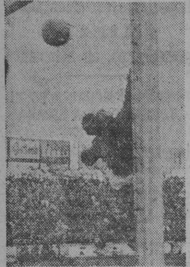
Uno de los cinco tantos del Español