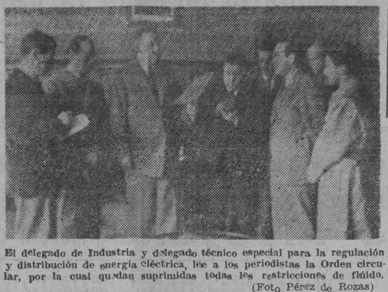
El delegado de Industria y delegado técnico especial para la regulación y distribución de energía eléctrica, lee a los periodistas la Orden circular, por la cual quedan suprimidas todas las restricciones de fluido.