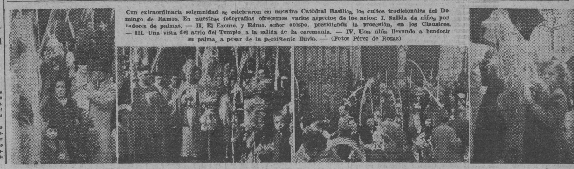
Con extraordinaria solemnidad se celebraron en nuestra Catedral Basílica los cultos tradicionales del Domingo de Ramos. En nuestras fotografías ofrecemos varios aspectos de los actos: I. Salida de niños portadores de palmas. — II. El Excmo. y Rmo. señor obispo, presidiendo la procesión, en los Claustros. — III. Una vista del atrio del Templo, a la salida de la ceremonia. — IV. Una niña llevando a bendecir su palma, a pesar de la persistente lluvia.