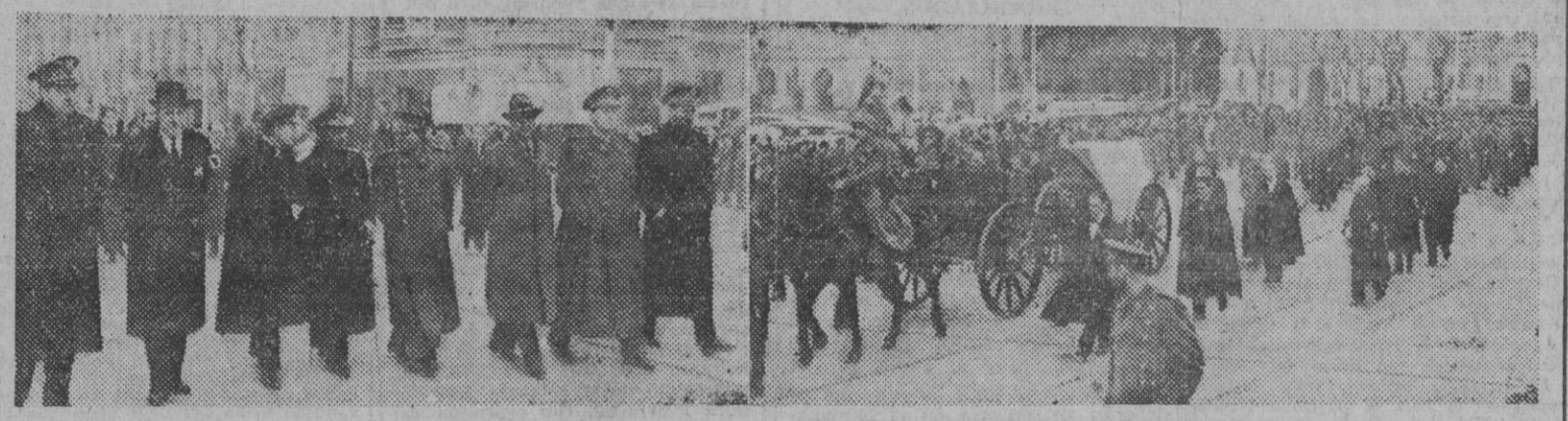
I. El Gobierno, en la presidencia del entierro del ilustre general. — II. La comitiva fúnebre, a su paso por las calles de Madrid.