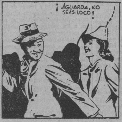
¡AGUARDA, NO SEAS LOCÓ!