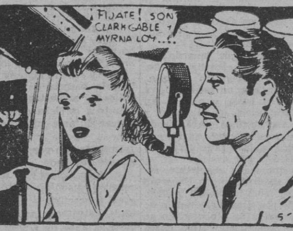
¡FIJATE! SON CLARIGABLE Y MYRNA LOY...