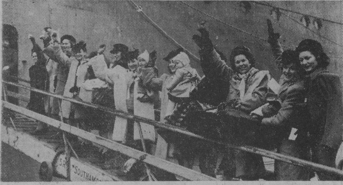
Un grupo de mujeres inglesas, esposas de soldados norteamericanos, en el momento de embarcarse en el puerto de Southampton, para emprender el viaje hacia los Estados Unidos, al objeto de reunirse con sus hijos de la infancia, en el momento de embarcarse en el puerto de Southampton, para emprender el viaje hacia los Estados Unidos, al objeto de reunirse con sus esposos.

SOUTHAMPTON, 2. (Servicio especial de la Agencia Efe para LA PRENSA, de Barcelona. Prohibida la reproducción.) — Una banda de música interpretaba alegres piezas mientras los miembros de la policía militar norteamericana ayudaban a subir por la pasarela del "Argentina" a las esposas y a