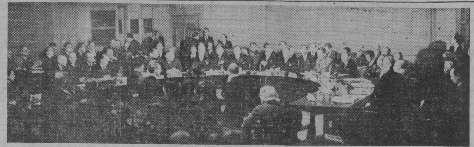
Vista general del salón donde se reúne la Asamblea de la U. N. O., durante una de las reuniones de la misma.