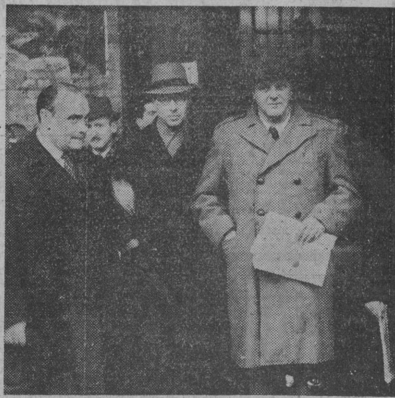
Randolph Churchill, hijo del ex "premier" británico, rodeado de los periodistas nacionales y extranjeros a su llegada a la capital de España.