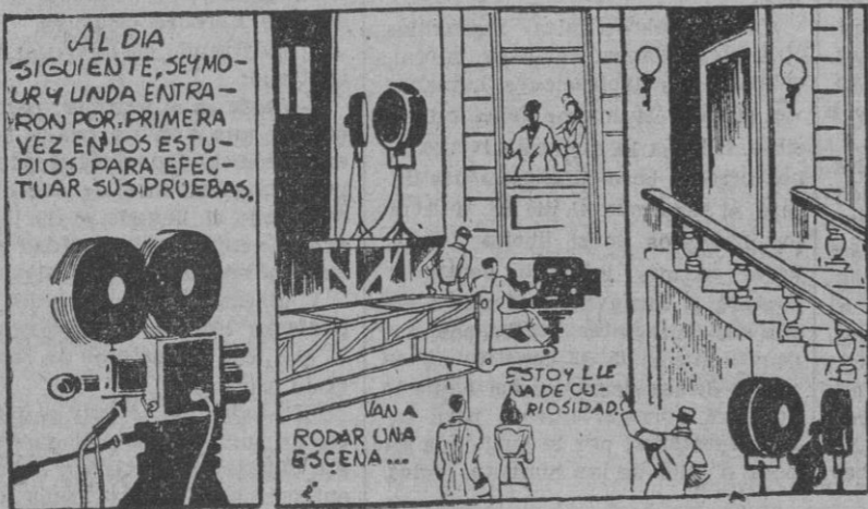
AL DIA SIGUIENTE SEYMOUR Y UNDA ENTRARON POR PRIMERA VEZ EN LOS ESTUDIOS PARA EFECTUAR SUS PRUEBAS.