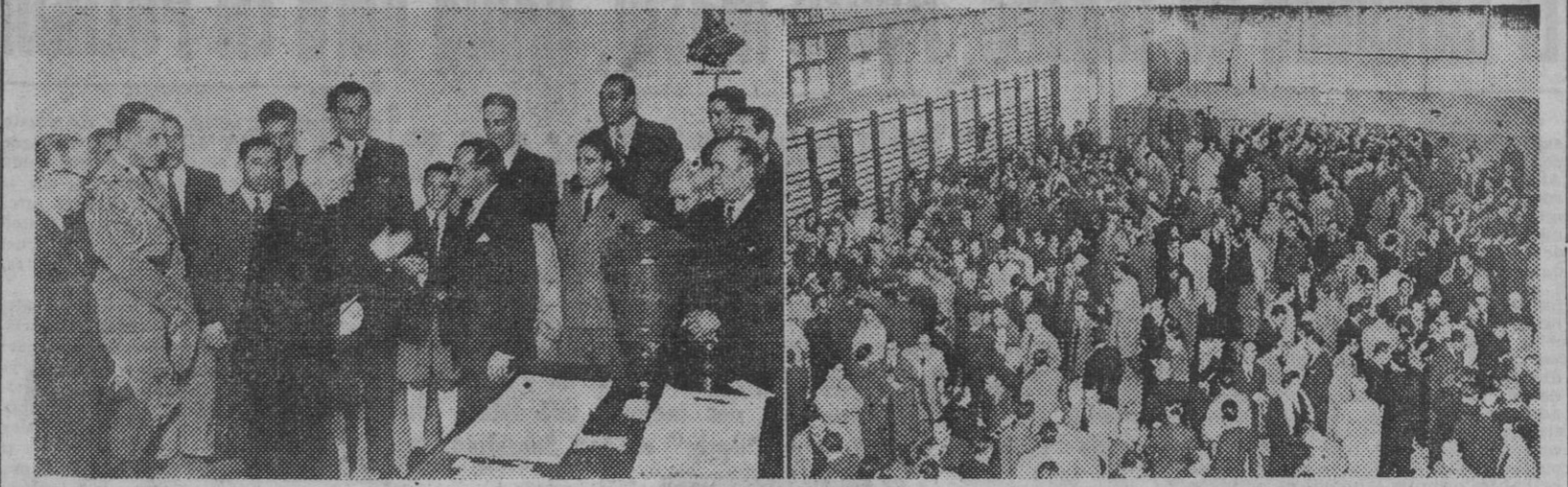
1. El jefe del Estado portugués, general Carmona, depositando su voto en el colegio electoral correspondiente. — 2. Aspecto animadísimo que presentaba el Liceo Camões, en Lisboa, durante el acto electoral. — (Fotos Sagrera)

“Lo importante para nosotros es el haber llegado, respetando la libertad y la dignidad humanas, a fórmulas de convivencia que faciliten el progreso de la nación.” Franco