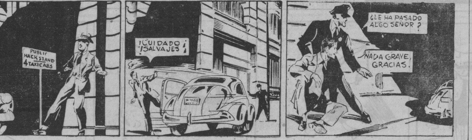
1. QUE HA PASADO ALGO SEÑOR? 2. NADA GRAVE, GRACIAS.