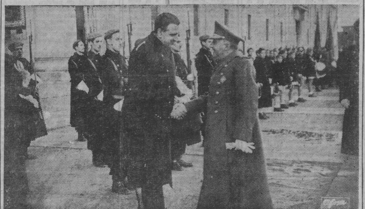
S. E. el Jefe del Estado estrecha las manos de los ministros del Gobierno, a su llegada al Monasterio del Escorial.