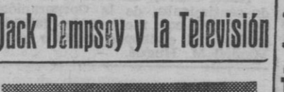
El antiguo campeón mundial de boxeo, Jack Dempsey, que acaba de firmar un contrato, por cinco años, como director de una compañía de televisión de los Estados Unidos, pago por el que cobrará 240,000 dólares anuales

A crisis francesa ha quedado resuelta y seguramente en esta edición se dará a conocer la formación del nuevo Gobierno. A la hora de escribir las presentes líneas —cinco de la tarde— se da como segura una lista de nuevos ministros, en la que figuran representantes de los tres principales partidos políticos.