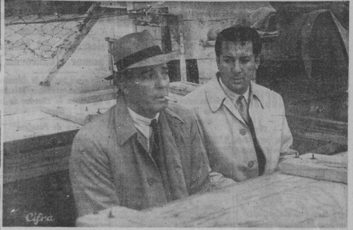
El nuevo seleccionador nacional de fútbol, Pasarín, acompañado de Ricardo Zamora, presencia el partido Atlético Aviación-Sevilla, celebrado el pasado domingo en el Estadio Metropolitano. El gesto de Pasarín y la expresión de Ricardo Zamora, resulta ser un elocuente diálogo mudo.