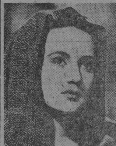
La "estrella" del film mejicano, "Así se quiere en Jalisco", María Elena Marqués, que actúa en este film musical con el notable cantante Jorge Negrete