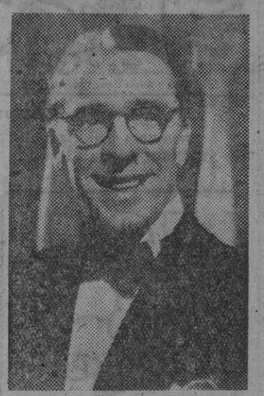
El notable actor Martínez Soria, director de la compañía de comedias que actúa en el teatro Poliorama con gran éxito.