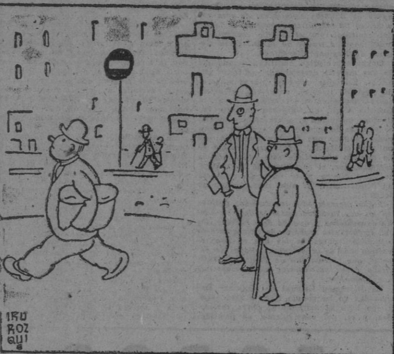
¡Qué orgullo! Ni saluda siquiera. Está insoportable. — Claro, como que le van a dar la representación de la península.