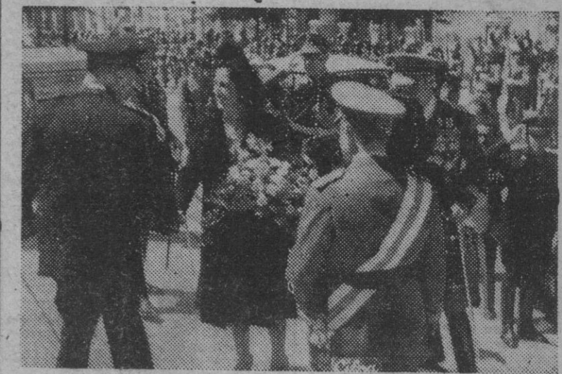
La esposa de S. E. el Jefe del Estado, doña Carmen Polo de Franco, es saludada por los ministros y autoridades a su llegada a la iglesia de San Jerónimo el Real donde asistió a la función religiosa organizada por la Asociación de Damas de San Fernando en honor del Patrón del Arma de Ingenieros.

Actos en Madrid en honor de San Fernando