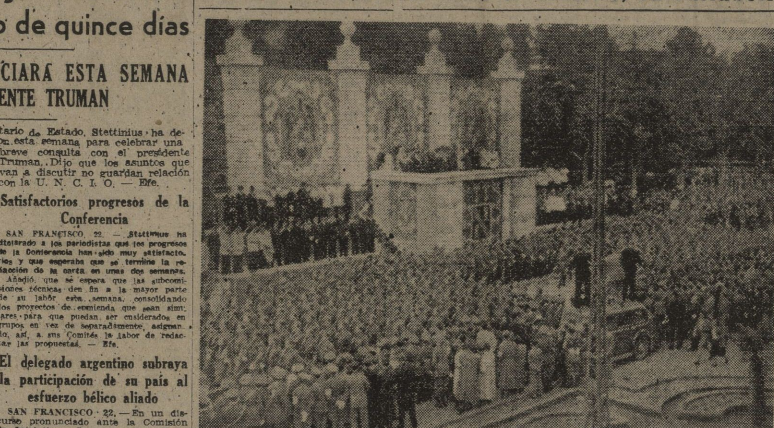
Las fuerzas del Ejército de guarnición en Valladolid, desfilando ante S. E. el Jefe del Estado...