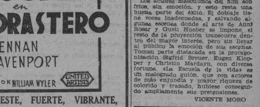
GARY COOPER en EL MISTERIO

Surge nuevamente en esta película la eterna contradicción entre el amor y el arte. El amor es cosa de instantáneo, el arte es una emanación propia de nuestro espíritu, y éste llega a imponerse después de una lucha de sentimientos que se desdobla en brillantes fuegos de arteficio. Esta es la tesis de esta película alemana, que con una mejor y mayor interpretación hubeiese sido catalogada en un plano de superproducción. De sus notables características características queda un argumento original, una cámara muy acertada en los exteriores y un diálogo hábil y preciso, que refleja con acierto las reacciones psicológicas de los personajes, que actúan con una personalidad muy destacada.