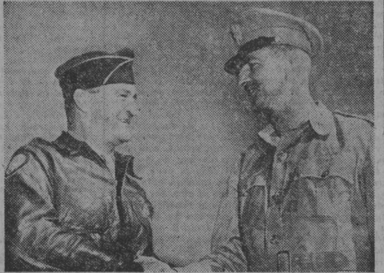
El general de división, Claire L. Charnault, a la izquierda, jefe de la XIV fuerza aérea norteamericana, saludando al nuevo jefe de las fuerzas de su nación, destacadas en China, general de división Albert C. Wedemeyer.