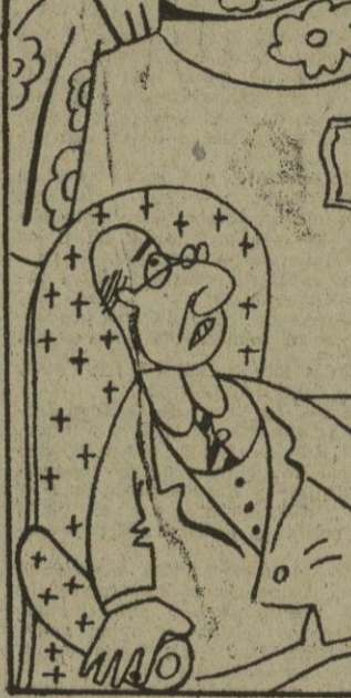
EL MARIDO: — ¡Pielés! ¡Abrigos! ¡Tapados! ¡Cuándo pararás con tu ofensiva de invierno! ¡Estás dejando a Stalin en mantillas!