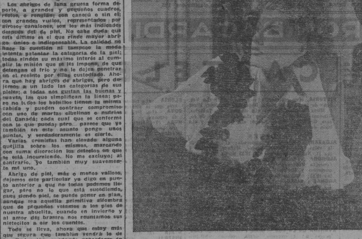
Elegante blusa de crepe satén blanca, con unas aplicaciones de flores de terciopelo. Puede llevarse con una falda del mismo género en negro o bien de terciopelo resulta muy elegante y puede llevarse perfectamente como traje de noche.

prestan un encanto más a los modas que de la misma se desprenden. Lo que también hay un dato muy interesante de ninguna manera que sería comprobar que la verdadera elegancia se desprende de llevar un abrigo de costura fina. Los abrigos de piel exigen algo de sus poseedoras, unos modales discretos, finos, elegantísimos. También pensó, razón, mas to-