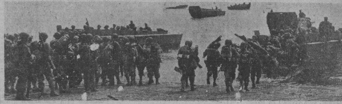
Tropas norteamericanas en el momento de embarcar en las unidades que han de transportarlas a la costa francesa, donde intervendrán junto a sus compatriotas en la batalla de Normandía.