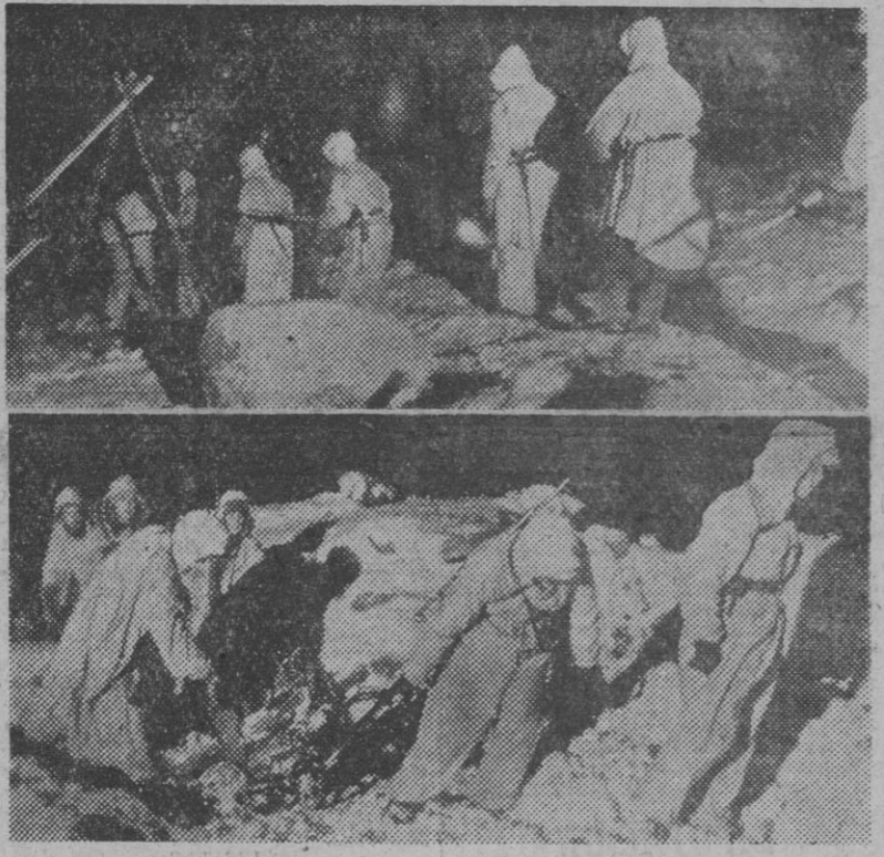
He aquí dos curiosas fotografías del frente de guerra en el Océano Glacial Ártico: Una patrulla de reconocimiento alemana se dirige, en plena noche, hacia las líneas enemigas para realizar un servicio. Algunas horas más tarde, la patrulla regresa trayendo consigo como botín una ametralladora pesada soviética.

Los aliados, rechazados al este del Orne y al sur y al sudoeste de Tilly Continúan los encarnizados combates defensivos entre el Vire y Saintely y en el sector de La Haye du Puits